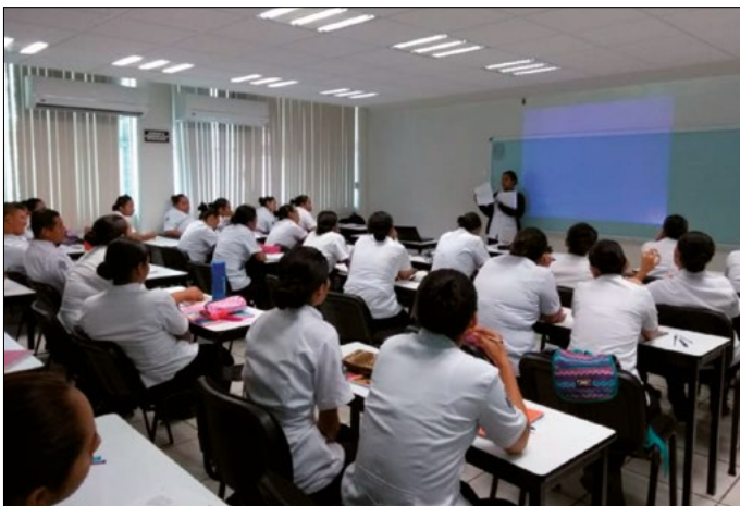
Figura 1. Estudiantes de un programa de educación superior.

El estrés está presente en todos los ámbitos de acción de un individuo, incluido el educativo, de ahí la preocupación de los integrantes del equipo de salud para conocer las implicaciones que este tiene sobre el rendimiento de los estudiantes; es decir, el estrés que los estudiantes experimentan (figura 1) durante su tránsito escolar.