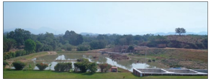
Figura 1. Unidad acuícola en desarrollo, municipio de Minatitlán, Colima.

El objetivo del presente estudio fue identificar y ponderar los criterios acuícolas requeridos para su óptimo desarrollo, principalmente en la zona costera del PCM (figura 1) mediante la aplicación de un análisis multicriterio (AM).