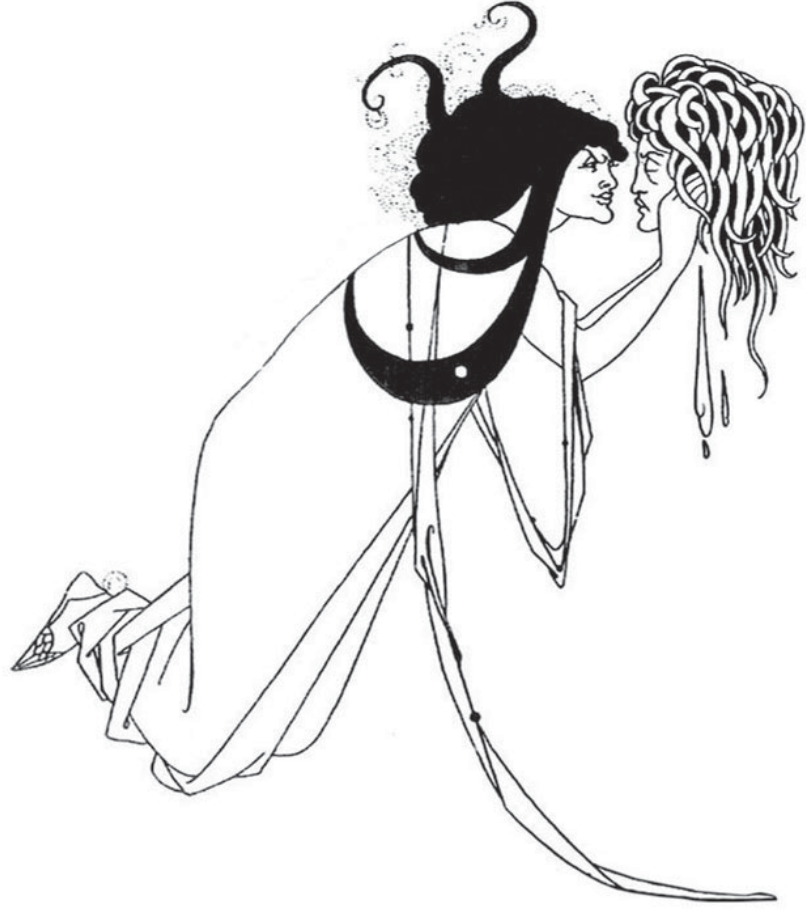
Aubrey Beardsley. Climax — ilustração para Salomé, de Oscar Wilde, 1894 (detalhe).