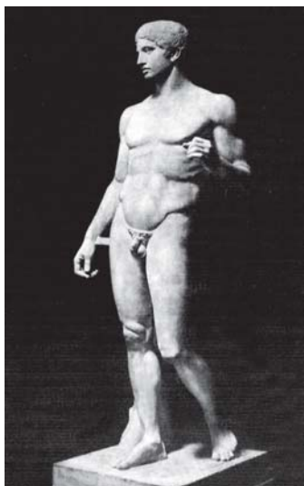
Policleto. O Doryphoro . c.440 a.C.

O livro de Kehl é coetâneo do filme Os deuses do estádio (1938) de Leni Riefenstahl, cineasta a serviço da propaganda hitlerista, fato que nos remete para a utopia da “perfectibilidade” da raça. Utopia que fez parte do ideário da intelligentsia brasileira, nas primeiras décadas do século XX, no projeto de regeneração da Nação, cuja história se fundava nas “mazelas” do cruzamento racial 35 . A perfeição era a meta. A utopia da perfeição