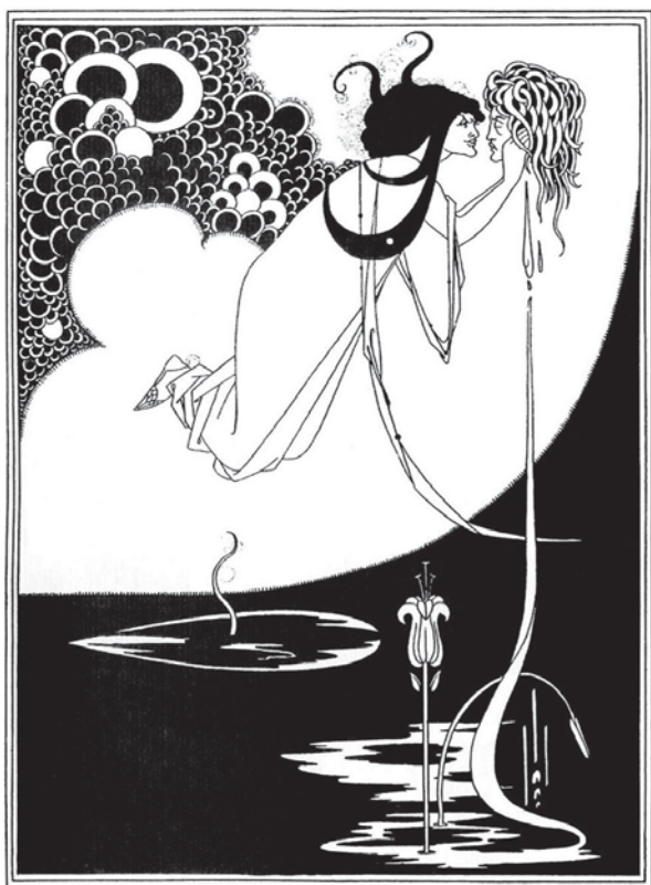
Aubrey Beardsley. Clímax — ilustração para Salomé , de Oscar Wilde. 1894.

Ciência e arte delinham o corpo na sua integridade, morfológica, antropométrica e fisionômica, visível pelo volume de massa corpórea, com suas margens contidas no contorno do desenho; regulado na sua representação pelos cânones da morfologia artística e na sua identidade, racial, sexual e social, pelas ciências humanas. Quando, em meados da década de 1870, aparece Salomé , de Moreau, “enfeitiçando, e mesmo domando as vontades de Herodes” 74 , inicia-se um ciclo de representação plástica e literária cuja fragmentação do corpo resvala-se até a perda da própria corporeidade, como se vê nos quadros de Salomé , de Aubrey Beardsley, para a peça Salomé de Oscar Wilde, publicada pela primeira vez em 1893.