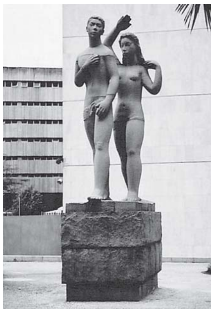
Bruno Giorgi. Monumento da Juventude . 1947.

19 Ver SONTAG, Susan. Fascinante fascismo. In: Sob o signo de Saturno . Porto Alegre: L&PM, 1986, p. 59-83.