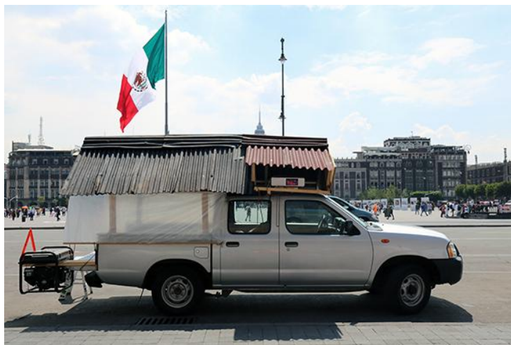
Imagen 2. Instalación de la performance: Migrantes silenciosos auto, parlante . Centro de información, México, 2019

Aquí se utiliza la enunciación “arte actual” y no “arte contemporáneo” porque de manera crítica puede argumentarse que el arte contemporáneo está vinculado física y comercialmente a dinámicas relacionadas con los mercados globales, de la misma forma que a capitales transnacionales y eventos internacionales como las bienales de arte o las ferias de arte que abundan en la actualidad en los centros de poder económico mundial. Las relaciones del arte contemporáneo con las dinámicas de mercadeo son cada vez más efectivas para el lavado de dinero y la reducción de impuestos en cantidades grandes que las empresas, corporativos y personas adineradas deberían entregar a los erarios públicos de los países donde producen sus ganancias. El arte contemporáneo es utilizado por los especuladores de la económica nacional e internacional que aprovechan los productos culturales y artísticos no solo para la evasión de impuestos sino para lograr reconocimiento social y estatus tanto como para establecer relaciones con los actores del poder con fines políticos y económicos. Las colecciones de los museos e instituciones públicas y privadas de alto nivel se nutren con obras de arte adquiridas a precios elevados.