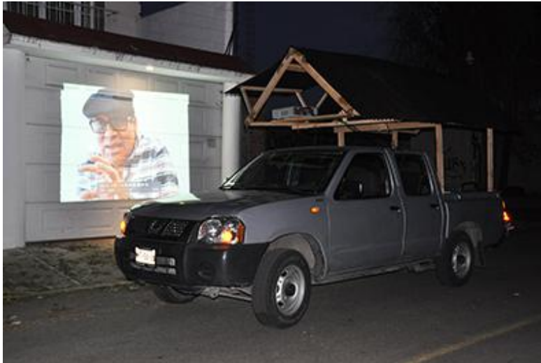
Imagen 4. Video instalación y performance: Migrantes silenciosos auto, parlante . Centro de información, México, 2019

La característica anterior está implícita en los testimonios recogidos por medio de la obra artística en la que se realizaron una serie de entrevistas a miembros de las caravanas de migrantes que pasaron por México entre 2018 y 2019 rumbo a la frontera norte. De los problemas políticos que azotan la región derivan otros temas identificados en los testimonios que dieron los migrantes, ellos delataron carencias en su educación que generaron pobreza material y todas las formas de violencia que azotan grandes sectores de la población no solo de México sino de gran parte América Latina. Tipos de violencia ejercidos sobre comunidades generalmente pertenecientes a minorías étnicas, raciales y de género, desprotegidos por los gobiernos. A ello están expuestas las personas que al atravesar las fronteras sufren además de las inclemencias del tiempo, la falta de recursos y sobre todo discriminación de los demás sectores de la sociedad