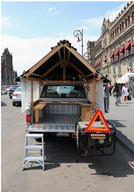
Imagen 5. Video instalación y performance: Migrantes silenciosos auto, parlante . Centro de información, México, 2019

Las imágenes y voces de los migrantes corresponden a informaciones y denuncias tomadas directamente de las fuentes de origen, llevadas al público en la calle también de manera directa con el fin de evidenciar sus necesidades, sin los filtros ni ediciones que utilizan los medios informativos. Las informaciones generales que llegan a la población vienen de los noticieros oficialistas que engañan y mienten al respecto. Hay una segunda fase de investigación que está en proceso y consiste en llevar los testimonios a las organizaciones que proporcionan ayuda y generan programas de apoyo a los migrantes. A través de otras fases de la investigación propias del arte, se establecen relaciones entre el móvil conceptual de la obra y la necesidad de sensibilizar a diferentes tipos de receptores, haciendo visibles en la esfera pública, las necesidades de un sector vulnerable de la sociedad que requiere apoyos urgentes. Se trata de un arte socialmente comprometido con problemas que afectan muchas personas en este contexto.