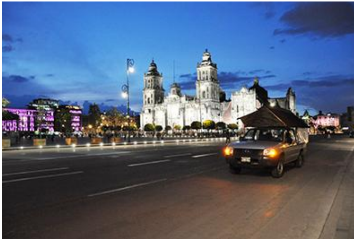
Imagen 3. Performance: Migrantes silenciosos auto, parlante . Centro de información, México, 2019

Por lo anterior en este artículo, se enfatiza el uso del término: arte actual , ya que la obra presentada más adelante no pertenecen a ningún circuito comercial de legitimación con esas características. Además porque de manera contradictoria, al mismo tiempo que en esos circuitos de legitimación se difunden informaciones sobre las maneras en que las bienales y las ferias unen a los países por medio de la democratización de la cultura, mienten al decir que; representan las ideologías de los organizadores en torno a las políticas internacionales y otros temas especializados con ánimo de hermanamiento universal, porque en ese mismo sentido se restringe el paso a las personas por las fronteras físicas entre los países participantes.