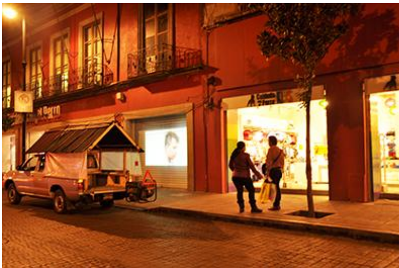
Imagen 7. Performance: Migrantes silenciosos auto, parlante . Centro de información, México, 2019

Para presentar la obra en el Encuentro Hemisférico de Performance se puso en acción una camioneta pick up , con una oficina en la parte trasera desde donde se proporcionaron al público participante, informaciones actualizadas sobre las migraciones en México. La oficina se instaló de manera improvisada entre una choza en la que el público pudo consultar publicaciones recientes con datos proporcionados por los centros de investigación de las universidades públicas mexicanas. Por medio de un alto parlante se reprodujeron las voces de los migrantes y sus testimonios, mezclados con sonidos de sirenas de ambulancias y patrullas; las voces de los migrantes se transmitieron para llamar la atención del público desprevenido. Los testimonios orales fueron interrumpidos periódicamente para ser reforzados con las informaciones video grabadas y presentadas directamente para no falsear el contenido. En el techo de la choza se instaló un video beam o cañón de imágenes desde el que se proyectaron los testimonios tomados en vivo y en directo, sobre los muros de casas y edificios. La camioneta circuló y proyectó la obra en lugares de concentración masiva del Centro Histórico de la Ciudad de México, con el fin de entregar datos reales sobre la situación de los migrantes, basados en informaciones que los noticieros oficialistas del país no proporcionan básicamente porque sus intereses son otros.