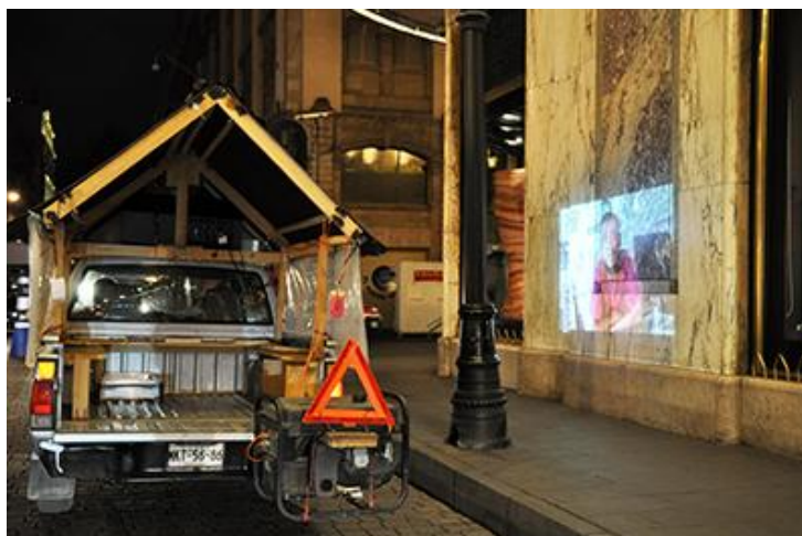
Imagen 6. Video instalación y performance: Migrantes silenciosos auto, parlante . Centro de información, México, 2019

Otro incidente de origen popular que sirvió para encadenar formalmente de manera sincrética las posibilidades conceptuales con la estructura presentacional de la obra consistió en valorar los altos niveles de contaminación auditiva que se ponderan en la Ciudad de México; aquí es común escuchar ruidos ensordecedores como las sirenas de las patrullas de policía, ambulancias y alto parlantes de todo tipo que incrementan el volumen de manera indiscriminada. En las colonias de la Ciudad de México circulan carros viejos con bocinas y grabaciones que anuncian la compra de chatarra y fierros viejos con voces que pertenecen a la tradición popular. El alto volumen y el ruido que se percibe en el entorno público es ocasionado por vehículos y vendedores callejeros que gritan por micrófonos y altavoces en las plazas públicas, afuera de las estaciones del metro y en lugares de congregación masiva, incrementando la contaminación auditiva. Estos elementos se utilizaron en la performance cuya presentación conllevó un segmento que puede ser entendido desde las teorías sobre la instalación artística.