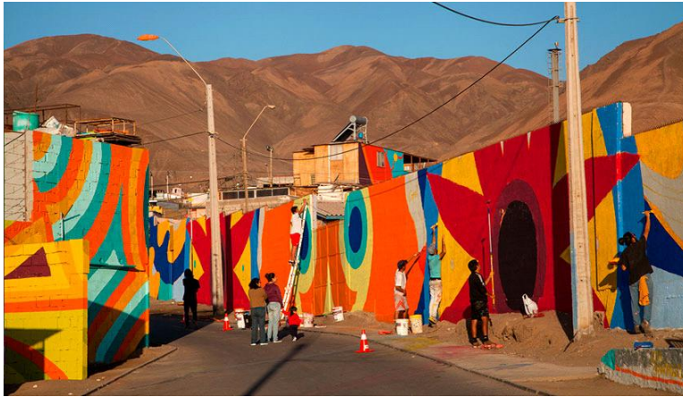
Figura 1. Antofagasta . Proceso de trabajo del proyecto Crossroads en Chile. 2016. (Fotos cedidas por Boa Mistura)