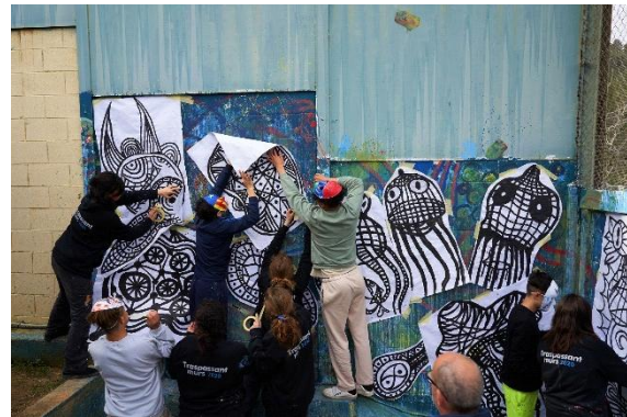
Figuras 6 (a) y 6(b). Parapupapià. Traspasando muros, detalle del proceso de realización del mural.