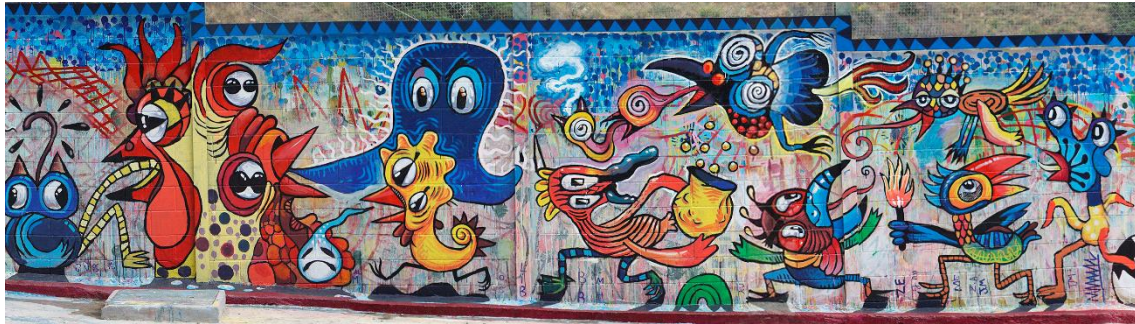
Figura 5. Parapupapià. Traspasando muros, detalle de una parte del mural.