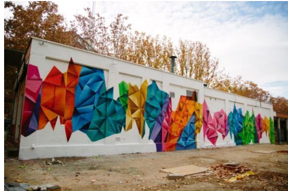
Figura 5, a y b. Compartiendo Muros Los claros del bosque , 2017.