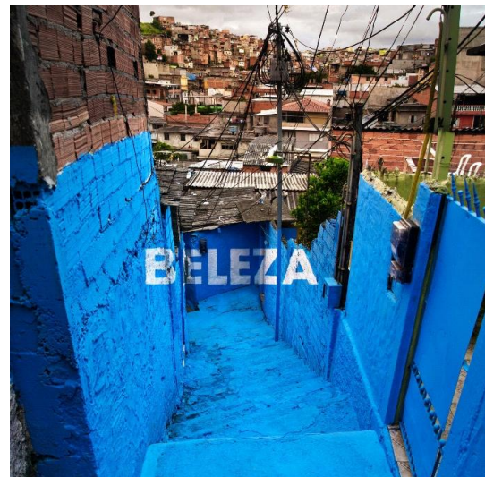
Figura 3, a y b. Amor y Beleza. Luz nas vielas , Sao Paulo (Brasil). 2012.

La poesía callejera por tradición ha ejercido la función constructora de un diálogo entre la obra y los habitantes de la ciudad. Muchos artistas activistas recurren a ella ya que, como apunta Klein, “priorizan la palabra sobre el arte plástico figurativo o abstracto. Buscan ser, a través de una poesía que haga pensar, una herramienta que genere una reflexión social transformadora hacia la construcción de un nuevo espacio público compartido” (2018, p.126).