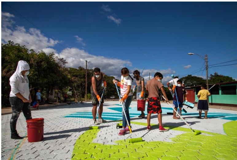
Figura 2. Somoto . Proceso de trabajo del proyecto Crossroads en Nicaragua. 2016.

En los proyectos cooperativos de Boa Mistura la poesía es uno de los vehículos de expresión, entendida no sólo como campo de experimentación con el lenguaje sino también con los materiales, soportes y espacios que ocupa. Las obras rompen los formalismos de la poesía tradicional consistentes en líneas que aparecen impresas en soportes bidimensionales para ser leídas en un orden familiar de izquierda a derecha y de arriba abajo. Su poética desafía estos supuestos utilizando medios materiales propios de la escultura y de la arquitectura, además de la palabra.