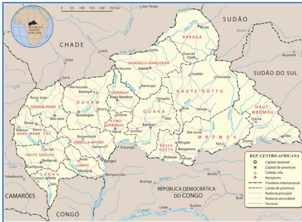
PLANO DE LA REPÚBLICA CENTROAFRICANA