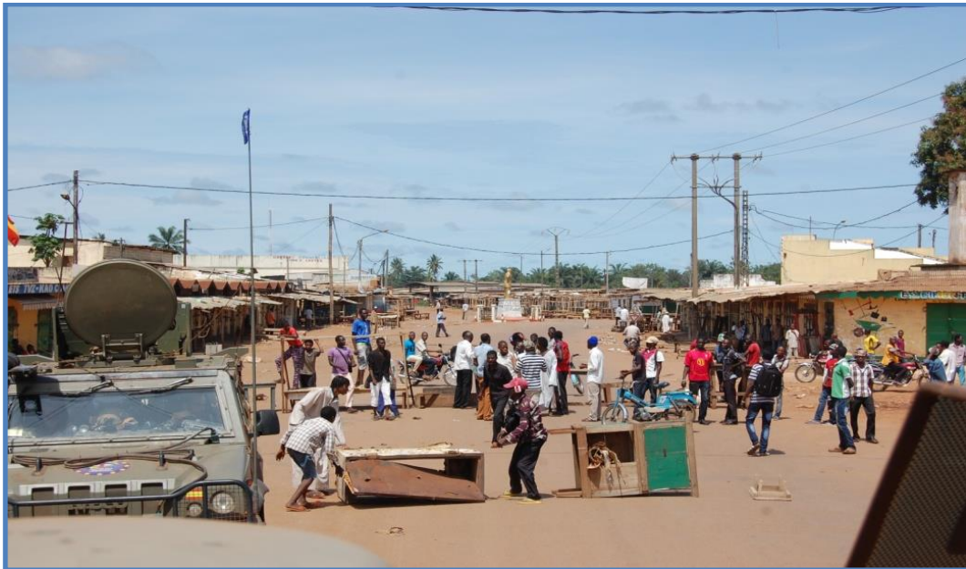
Barricada en PK5, en el barrio musulmán del distrito 3

enero, en los campamentos de BSS y Beal 8 en el distrito 1. En estas antiguas bases militares, el mayor peligro es el arsenal de armas y explosivos que se encuentra en su interior, y que el gobierno quiere dismantelar con la máxima urgencia. En noviembre, y hasta en tres ocasiones, los antiguos milicianos bloquearon con armas las carreteras adyacentes para reivindicar mejoras en sus condiciones de vida y para exigir el cumplimiento de las promesas gubernamentales respecto a su reintegración en unas futuras, y aún lejanas, Fuerzas Armadas Centroafricanas (FACA). Estas manifestaciones armadas fueron controladas con éxito por las fuerzas internacionales, que evitaron así una posible colisión con facciones armadas Anti Balaka.