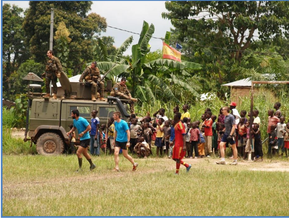
Partido de fútbol hispano-centroafricano en el barrio de Berkail

En un país donde el fútbol es deporte nacional, también este ha servido como “vehículo español” –y más tarde adoptado por otros contingentes de EUFOR RCA– para ganarse el afecto de los centroafricanos. Desde principios de junio, siempre con unas medidas férreas pero “amigables” de seguridad, comenzaron a jugar partidos amistosos en los distintos barrios de la capital, algo que les permitió, además de una mayor proximidad humana, conocer y entender aún mejor a la población de Bangui: «el fútbol no sólo sirve para ganar títulos –enfatisa el comandante Alejandro Nacarino, jefe del Centro de Operaciones del SOCC–, y en este país nos ha valido para crear confianza mutua, además de abrirnos puertas en distritos muy complicados». También los desplazados, tanto en el campo de M’Poko como los que se refugian en las misiones religiosas, recibieron el apoyo y el calor de los militares españoles, conscientes de que cualquier acción, cualquier gesto humano, ayudaría a aliviar tanto sufrimiento: «En un principio, este conflicto no tenía un sesgo religioso, pero hemos trabajado en todos los lugares y en todos los ámbitos para frenar los enfrentamientos, para que la gente pueda volver a sus hogares y para que, algún día, puedan llegar a la reconciliación. Se ha conseguido mucho, pero hay mucho más por hacer para conseguir una paz definitiva y una estabilidad duradera», subraya el sargento Alberto C.