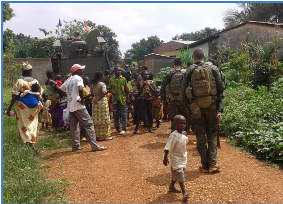
Barrio de Kokoro, distrito 3, en la zona conocida como “ no man land ”

A pesar de los numerosos frentes abiertos del conflicto, y sin minusvalorar la gravedad de ninguno de ellos, lejos quedan las execrables masacres cometidas durante el nefasto gobierno de Djotodia, que abandonó el poder el pasado 10 de enero; y también la venganza desatada por los rebeldes Anti Balaka desde diciembre, que sellaron el periodo más convulso y violento en la historia de este país centroafricano, con miles de muertos y con el éxodo masivo de cientos de miles de musulmanes. Sin duda, en la mejora de la situación ha influido de forma determinante, y no carente de riesgos para las fuerzas desplegadas, la presencia en el terreno de más de 10.000 militares internacionales, enmarcados en la Operación francesa Sangaris (2.000), en la misión europea EUFOR RCA (750) y en MINUSCA (7.500) 9 , de Naciones Unidas. Aunque estas fuerzas son aún insuficientes para poner fin a este convulso conflicto, es innegable que, desde sus distintos cometidos y áreas de despliegue, han conseguido estabilizar notablemente la capital Bangui, y también algunas zonas interiores del país.