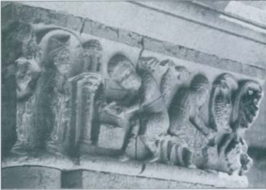
Claustre de la seu de Girona (Segles XI-XII): El bisbe vigila la feina d'uns picapedrers.

haguessin poques persones capaces de menar i endegar una construcció; i que l'ofici d'arquitecte o de mestre d'obres comportés sovint un cert nomadisme, obligat per la carència de treball continuat en un lloc fixe. Precisament al nord de l'Itàlia actual hi hagué gent que s'especialitzà en aquesta feina i, molt abans ja d'arribar a l'època romànica, s'hi organitzaren colles d'obrers transhumants que es desplaçaven allà on la feina els reclamava, a l'imperi franco-germànic inicialment. Aquestes colles provenien de la regió dels llacs Como i Major, a la Llombardia, i acostumaven a ser conegudes amb el nom, provinent del primer d'ells, de mestres "comacinis"; i també pel de la regió d'on procedien: mestres "llombards" o "lambards", per degeneració. Ja l'any 713 el rei de Llombardia Luitprande promulgà un edicte en el que establia una barreja de reglamentació laboral, plec de condicions i definició de responsabilitats, que regulava les relacions entre els mestres lambards i els que els llogaven.