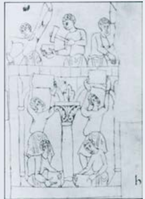
Bíblia de Roda, procedent de Ripoll (Segle XI): Construcció d'un finestral.

Algunes vegades intervenien en les construccions rurals sobretot quan aquestes depenien del seu monestir. En general, però, en aquests llocs només es comptava amb la mà d'obra voluntària de la gent que hi habitava, rústega i sense coneixements constructius, i amb la direcció, més o menys intel·ligent, del rector o d'un monjo no massa capacitats, cosa que donà lloc a la majoria d'esglésies que ens han pervingut, rústegues i senzillíssimes. Així ho llegim en moltes actes de consagració d'esglésies: la de Santa Maria de Fontanet de l'any 901 ens diu que fou edificada per l'amor de Déu per una serie de feligresos que enumera; la de Sant Pere de Riuferrer del 1159, ens consta que fou reedificada per l'abat, al que s'uniren l'hebdomari de la pròpia església, els habitants de la vall i altres homes honrats de la terra, moguts per l'amor de Déu i la redempció de les seves ànimes.