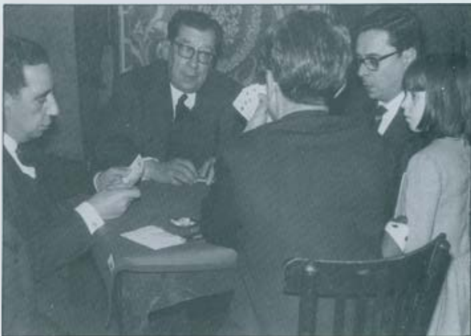
Els quatre germans jugant el bridge. (Nadal 1963).