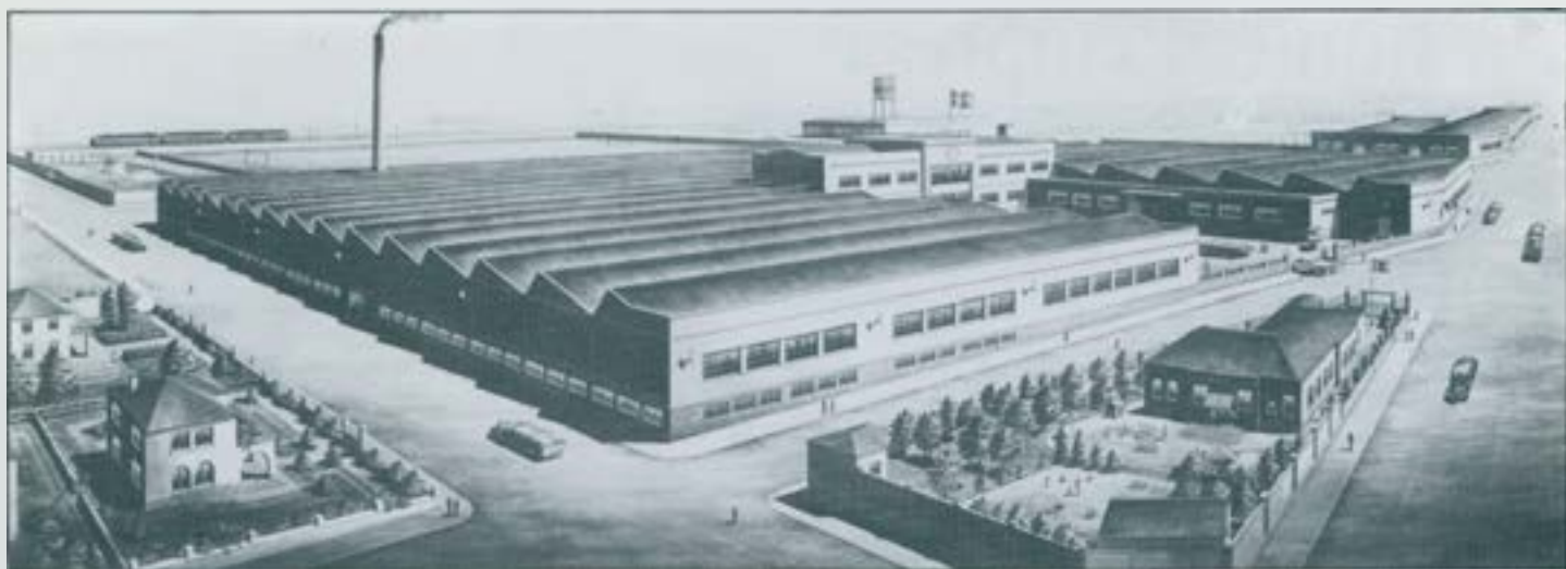
Projecte de S.A. Marcet

I no podríem cloure aquesta resumida relació sense incloure-hi l'ASEACES, de nova planta, de Sant Quirze del Vallès, començada l'any 1963, i la de Motores Claret S.A., després Unidad Hermética, ubicada a la mateixa població.