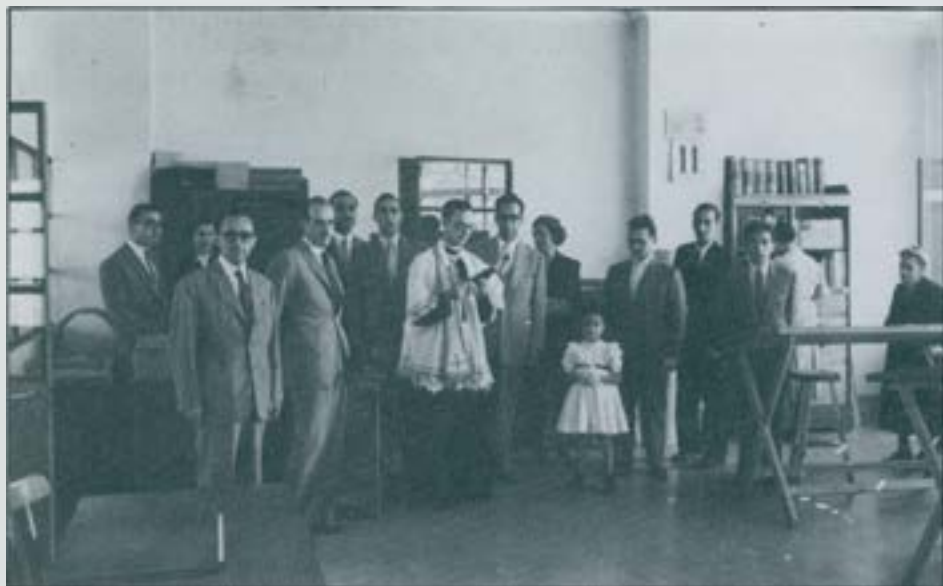
Benedicció de les oficines de CES, oficina de professió lliure. Edifici del carrer Sol i Padrís núm. 1

hona S.A. que hi féu les modificacions i ampliacions adequades, necessàries per a la fabricació i transformació de plàstics, activitat a què es dedica aquesta firma.