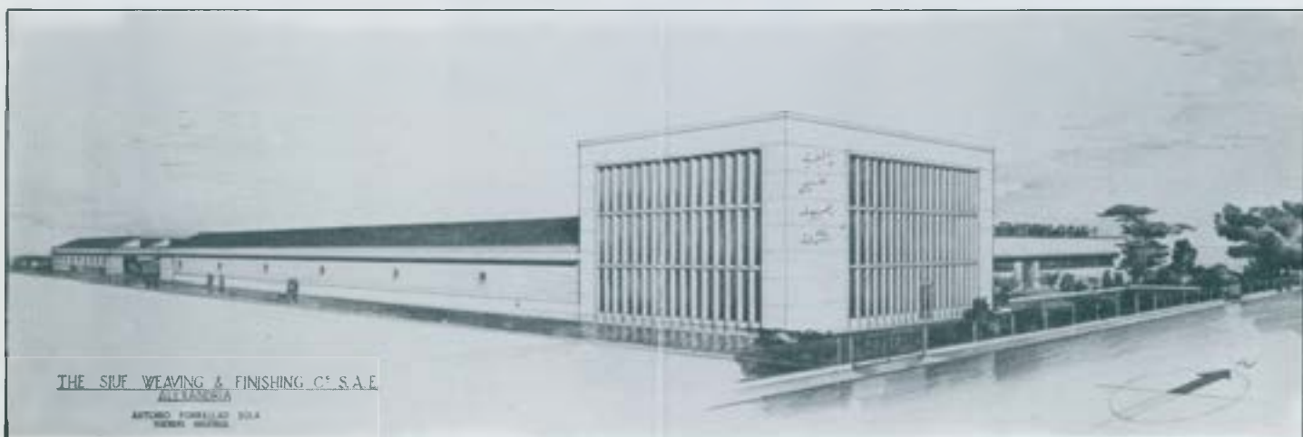
THE SUF WEAVING &amp; FINISHING C. S.A.E.