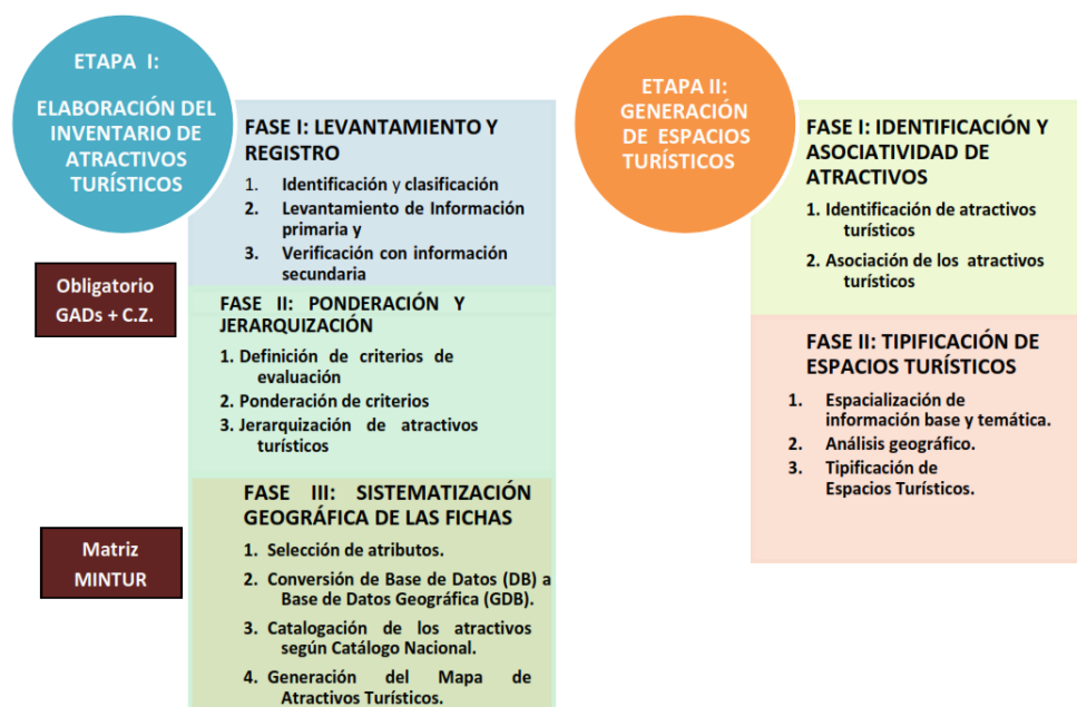
Figura 1. Etapas de guía metodológica.

Etapa II: Generación de espacios turísticos e identificación de atractivos con potencial, su análisis y tipificación (MINTUR, 2017)