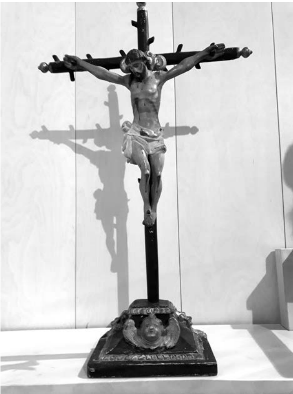
Figura 4: Sant Crist, 1670-1700, església de Fondarella.

Dins de l'església de Santa Maria de Fondarella, al marge de la creu processional també trobem un petit Sant Crist (fig. 4). Es tracta d'una escultura formada per un Crist clavat a la creu recolzat en un pedestal quadrangular, decorat per motlures i un serafí o cap d'àngel amb ales; el conjunt sencer té una alçada aproximada d'1 metre. El cos de Crist presenta una anatomia notable, i cobreix les vergonyes amb el perizonium o drap de puresa a l'alçada de la pelvis. La policromia de la carnació podria ser original, i també hi ha abundants reguerons de sang arreu del cos. La creu és de la tipologia arborescent, és a dir, en forma d'arbre amb els grills de les rames tallades,