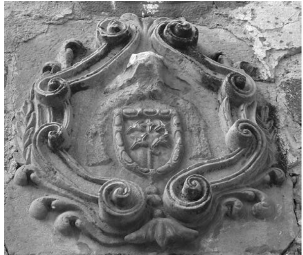
Figura 5: Escut de Nicolau Cotoner, cap al 1700, església d'Aguilella.

Dins el terme de Barbens trobem la petita església del nucli d'Aguilella, dedicada a santa Maria. El temple actual és d'inicis del segle XVIII, i el més destacat és la portada, feta amb carreus regulars de pedra, i una motllura que l'envolta. Sobre d'això trobem un escut heràldic (fig. 5) que s'hauria de relacionar amb la