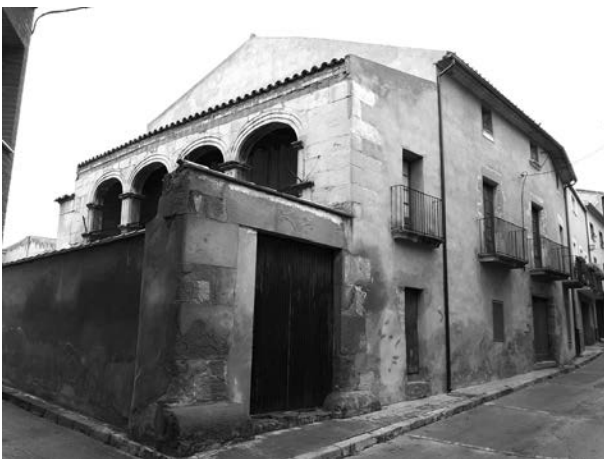
Figura 14: Cal Galceran, 1781-1802, Linyola.

La casa de Cal Galceran (fig. 14) s'aixeca a la cantonada entre el carrer Ramon i Cajal amb el carrer Cristòfol Colom de Linyola. Fou edificada per la família