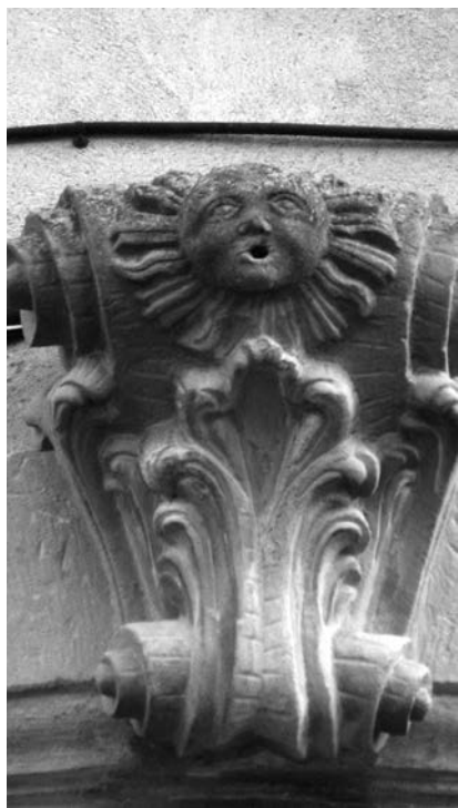
Figura 12: Mènscula, Cal Pere Passa, 1766, El Palau d'Anglesola.

això deuria provocar que no s'acabés fent un portal adient a l'esplèndida decoració que té la casa en els pisos superiors, una cosa que és força estranya.