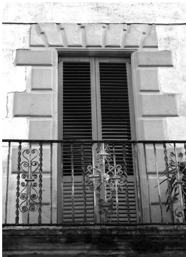
Figura 7: Balconada de l'antic sindicat, cap al 1720, El Palau d'Anglesola.