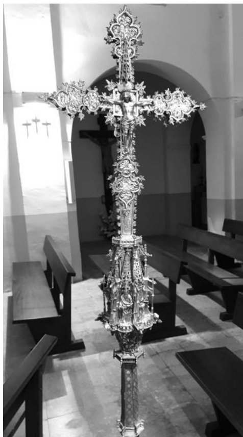
Figura 2: Creu processional, 1575-1650, església de Fondarella.