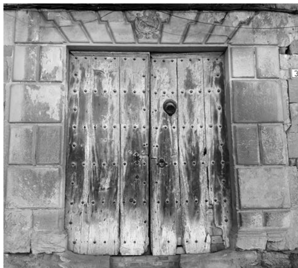
Figura 8: Portada de Cal Bufalà, 1726, Bellvís.