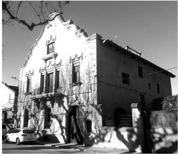
Figura 18: Cal Calvet, 1920-1921, Bellvís.

Com s'ha d'etiquetar aquest estil artístic? Allò fàcil seria dir que és una obra neoclàssica, però al llarg del