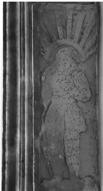
Figura 16: Sant Isidre en una llosa de balcó, cap a 1800, Bellvís.

Gràcies a les indicacions de Jaume Suau vaig assabentar-me de l’existència d’aquesta obra. Es troba en una casa pairal de Bellvís, concretament al carrer del Rosari número 2. Un immoble, de tres balcons amb lloses motllurades, que s’hauria de datar cap a l’any 1800, perquè tant es podria situar a la darrera dècada del segle XVIII com a la primera del XIX. Sota la balconada que queda a mà esquerra de l’espectador es pot observar un relleu (fig. 16): una figura humana, masculina pel tipus de vestimenta (s’adverteix un saió curt), vista dempeus i amb una mà sobre el pit. A sobre