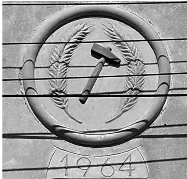
Figura 21: Emblema del sindicat vertical, antic sindicat agrícola, 1964, Miralcamp.

forma y procediendo dicho arrentamiento el referido magnífico baile, en calidad de legítimos administradores que somos de los bienes, réditos y emolumentos de la Obra de la iglesia parroquial del expresado lugar. Arrendamos a Francisco Albareda y su hijo Francisco Albareda y Font, albañiles de Hoz, de dicho corregimiento, presentes, abaxo acetantes, a los suios, a quien quisieren el asiento de las obras de edificar el campanario de la iglesia parroquial del presente lugar del Poal, con los pautos