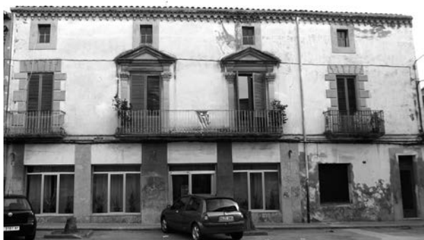
Figura 6: Antic sindicat, 1720-1789, El Palau d'Anglesola.

A la plaça major del Palau d'Anglesola s'alcen dos casalots barrocs força interessants. Un és l'antic sindicat, després conegut com el Bar Sport (fig. 6). Per les inscripcions de les finestres, sabem que la casa fou bastida per la família Queralt al segle XVIII. A inicis del segle XX era propietat d'un cabaler de cal Fages, que ho va vendre cap al 1920 al llavors recent creat Sindicat Agrícola del poble, moment en què la casa va esdevenir la seu central del sindicat, amb oficines i lloc de treball, espai per una caixa rural local del mateix sindicat, i punt central per a esbarjo (amb cafè i sala