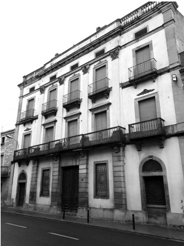
Figura 17: Cal Palau, cap al 1857, Vilanova de Bellpuig.

XVIII, a tenor de l'epigrafia d'una llinda que hi ha a la part del darrere de la casa: FRAN(cis)CO PALAV / ANY 1797. En tot cas, ara tractem sobre una reforma posterior, la façana, que cal datar cap al 1857, data que apareix al mig de la barana del balcó, acompanyada de l'emblema heràldic familiar (un edifici o palau coronat amb un elm). Crida força l'atenció un cos central amb quatre pilastres d'ordre gegant que uneixen el primer i el segon pis, així com la projecció d'aquestes a la planta baixa mitjançant carreus regulars; també són interessants les finestres motllurades, la línia de cornisa superior, una balustrada que corona el conjunt i la decoració puntual amb elements ceràmics (capitells, volutes i sanefes vegetals). Un prototipus similar, lleugerament més senzill, el podem trobar a Cal Miqueló (antigament Cal Pascol) que trobem a Sant Martí de Maldà, ubicada a la Plaça Major número 15; de la qual també val la pena destacar l'ús de la mateixa tipologia de barana de ferro, feta a base d'elements motllurats.