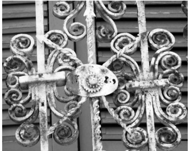
Figura 9: Reixa de l'Antic sindicat, 1789, El Palau d'Anglesola.

Les balconades centrals, flanquejades per pilastres amb capitell corinti i un entaulament clàssic sense cap tipus de decoració escultòrica, tenen un estil propi de finals del segle XVIII, i que concorden millor amb les dates esmentades. Les inscripcions són: a la esquerra, ANY / 1766 / A 5 DE / MARS; i a la dreta, ANTON / QUERALT / Y / TERÉS / A 1 DE DESEMBRE / ANY 1785 (amb la presència de dos cors). La datació de les balconades classicistes s'ha d'ubicar entre 1785 (la data més tardana de les inscripcions) i el 1789 (data que apareix a una de les reixes de ferro –fig. 9–, amb