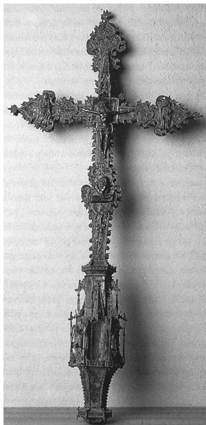
Figura 3: Creu processional, 1575-1600, Museu de Lleida: Diocesà i Comarcal.