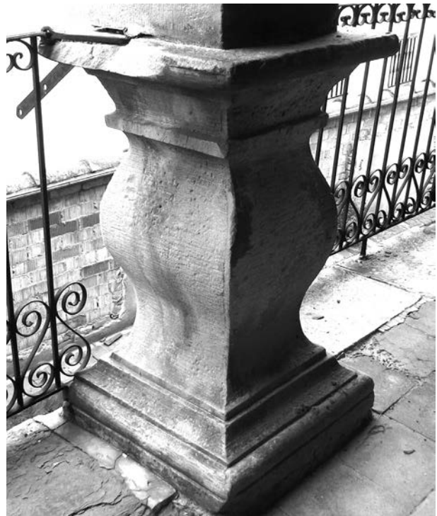
Figura 15: Basament bombat a la galeria de Cal Galceran, 1802, Linyola.

cognominada Galceran, que a inicis del segle XVIII van tenir un paper protagonista a la vida linyolenc. Un d'aquests membres fou Francesc Galceran, que va esdevenir alcalde de la vila el 1715, el 1722 n'era el regidor i el 1723 regidor major. 8 Un altre fou Magí Galceran, prevere a l'església parroquial de Linyola, concretament ostentava el benefici de la capella de sant Miquel; també va arribar a ser l'home de confiança a la plana d'Urgell de Pere Gomar, un candeler de Bellpuig que entre 1701 i 1729 va ser procurador general del duc de Sessa (que també era baró de Linyola) a tot el Principat de Catalunya. 9