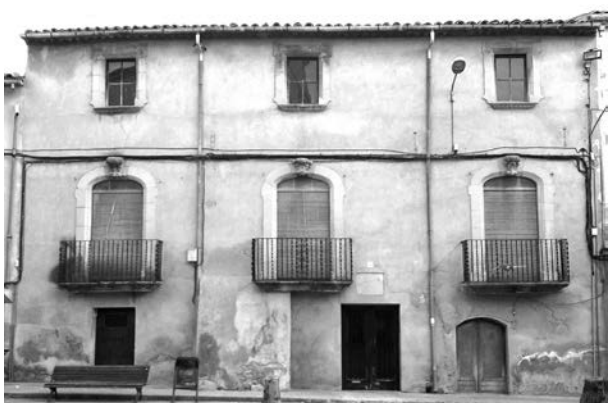
Figura 11: Cal Pere Bassa, 1766, El Palau d'Anglesola.