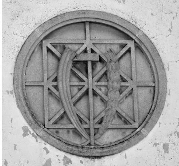
Figura 20: Emblema del sindicat vertical, antic sindicat agrícola, cap al 1960, Castellnou de Seana.