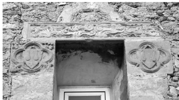
Figura 1: Escut dels Culleré, segle XIV, Antiga rectoria, Bell-lloc d'Urgell.

En la part superior hi ha un fragment de predel·la d'un retaule gòtic, atribuït a l'escola de Lleida de la segona meitat del segle XIV. 1 Al marge d'això, trobem altres fragments. Un és un muntant amb relleus de ramejats, segurament del segle XVIII, disposat com si fos una llinda. I també el que ens ocupa, un parell d'escuts heràldics en un marc polilobulat (fig. 1). Dins hi ha la representació d'un pavès o escut amb les armes de la família en qüestió, amb una soga a la part superior que permet penjar-lo figuradament en un clau. L'element que permet identificar l'heràldica està duplicat i no és gaire comú. Després de descartar figures, peres, carbasses i altres opcions, aposto per dues culleres o cullerots. Això ens porta cap a la família Culleré o Cullerés, present a Bell-lloc d'Urgell en els fogatges de 1497 i 1553, a més de ser un cognom relativament usual a la plana d'Urgell encara avui en dia.