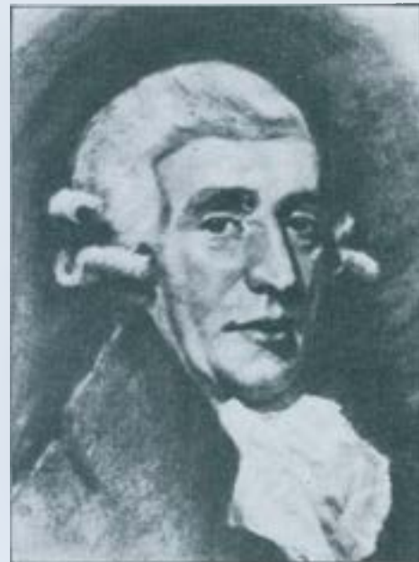
Franz Joseph HAYDN (1732-1809).

En aquest segle XVIII, els canvis intel·lectuals que provoquen les idees de la il·lustració es va intentar d'aplicar-los a l'àmbit de la política i de l'economia; així, prínceps, governants i dirigents convertiren d'una forma complexa i contradictòria una Europa configurada com a mosaic de corts imitadores de la de Versalles, en l'espai d'una societat emancipada, per l'acceptació del protestantisme, del poder religiós i polític del Papat. Acabades les guerres religioses, assolida l'expansió francesa en el segle anterior i amb l'acció d'uns Habsburgs (Maria Teresa d'Àustria i Josep II), poderosos propagadors de les noves reformes i dels seus súbdits (Edicte de la Tolerància), Europa viu un clima d'equilibri, tranquil·litat i benestar momentani que farà que aquesta societat nova es vegi transformada per la individualització refinada del gust ( la douceur de vivre ) en el qual pren preponderància el delicat sobre el sublim d'un barroc en decadència. Una Àustria poderosa que admet la tolerància religiosa i cultural d'altres comunitats lingüístiques no germàniques converteix Viena en la forja europea de cultures per l'aportació que fan les distintes nacions unides -políticament- per la corona imperial dels