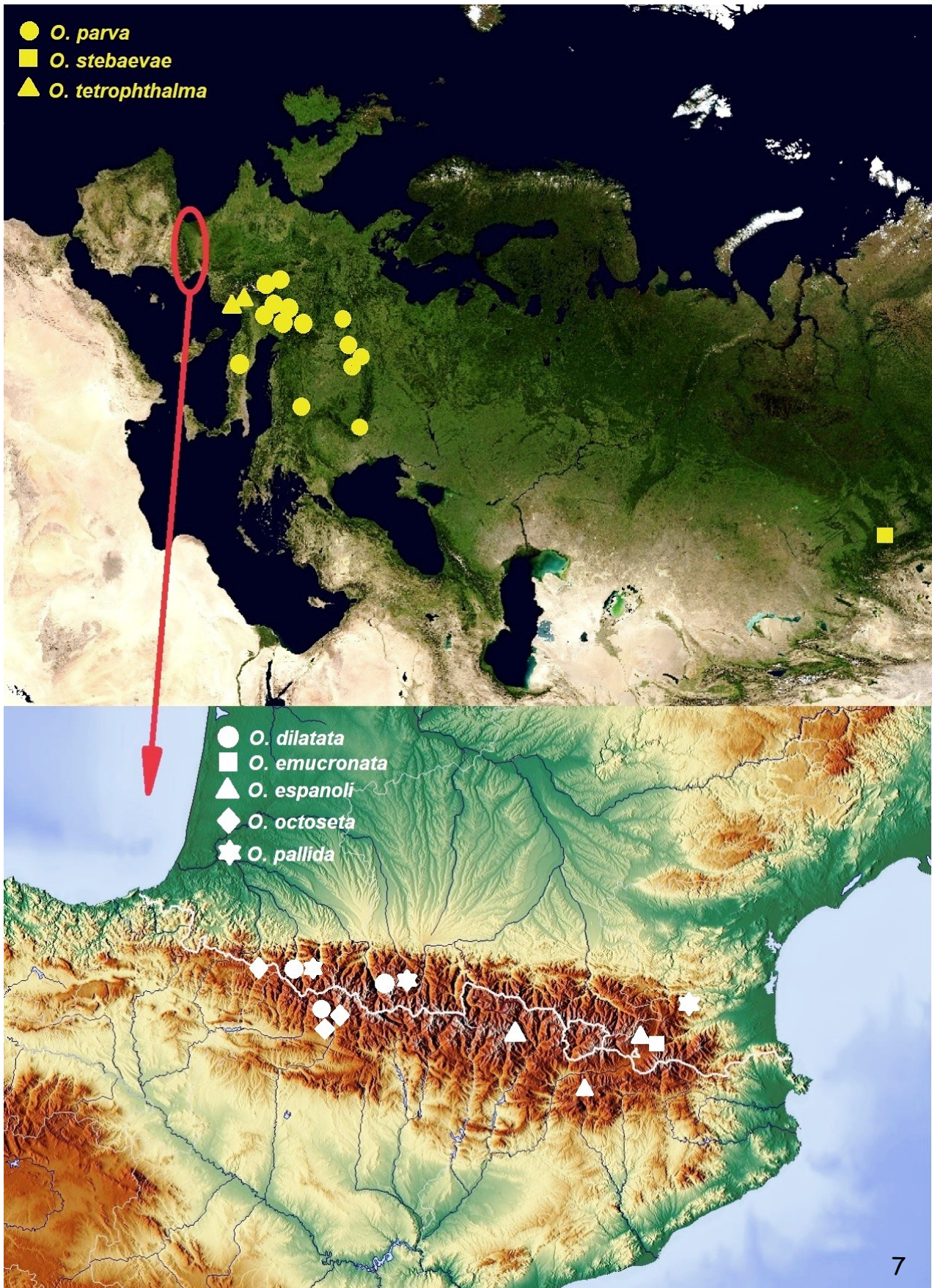
Fig. 7. - Distribución de las especies europeas de Orogastrura .