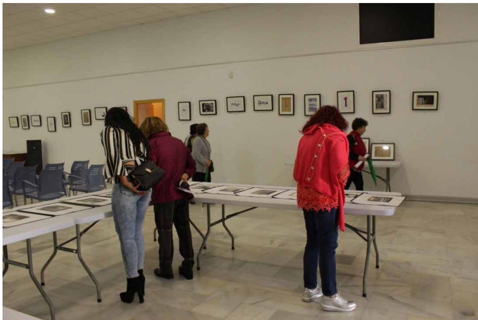
Fotografía 4. III Festival de Poesía Visual de Berja (2019)