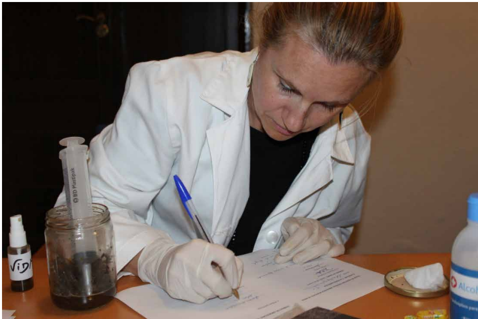
Fotografía 3. Taller El Perfume (Esencia Poética)