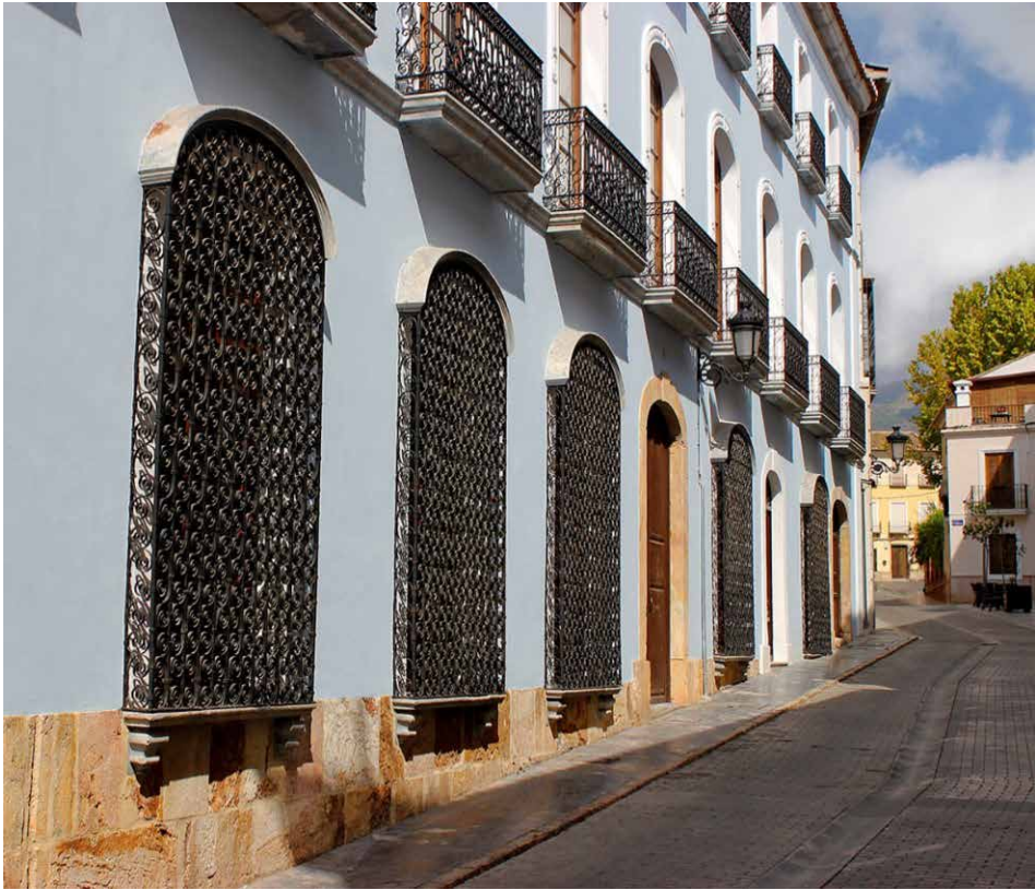
Fotografía 1. Fachada de la Biblioteca Municipal