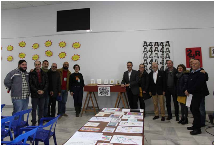
Fotografía 8. Visita del Delegado de Cultura al II Festival de Poesía Visual de Berja

El II Festival de Poesía Visual de Berja, fue premiado al mejor proyecto bibliotecario provincial de fomento a la lectura y en especial, a la poesía visual, por su capacidad de aglutinar a todas las artes y como diría Joan Brossa: “en una sola mirada”. Premio otorgado por la Delegación Territorial de Cultura, de la Junta de Andalucía.