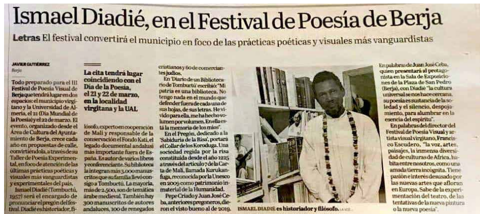
Fotografía 13. Nota de prensa sobre pregonero del III Festival de Poesía Visual (2019)