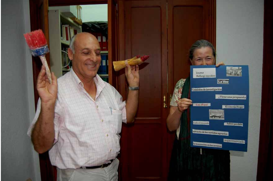
Fotografía 2. Taller Poemas y Acciones Dadá.

Los objetivos del Taller de Poesía Experimental de la Biblioteca Municipal, El Taller de POEX, fueron desde un principio, dinamizar la Cultura de Berja, desde un taller que aglutinara todas las artes. Un taller laboratorio de pensamiento y creación abierto a la participación de todo el mundo. Siendo “Las Otras Escrituras o las Escrituras Inventadas” las protagonistas del Proyecto. Vivimos tiempos de naturaleza líquida. La inmediatez marcada por las redes sociales nos hace ver la realidad de manera fugaz. La poesía vuelve a la esencia del Haiku. A la poesía (no poesía) de las vanguardias. Siendo la experimental la que nos permite integrar a todas las artes, artistas y formas diversas de participación: escritores, pintores, escultores, fotógrafos, performers, músicos... Así de plural es el grupo del taller. Y todo el protagonismo lo tiene la imagen, lo visual. El texto pasa a un segundo plano o ya no aparece.