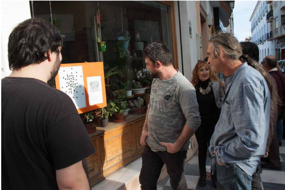
Fotografía 16. EXPOESÍA ESCAPARATES. I Festival de Poesía Visual (2017)