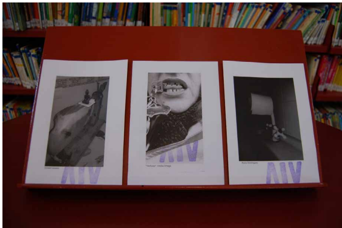
Fotografía 6. A-4 Hojas Poéticas Especial Taller