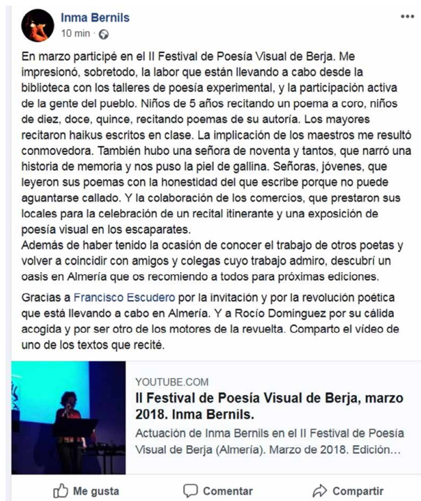
Fotografía 11. Comentario de Inma Bernils