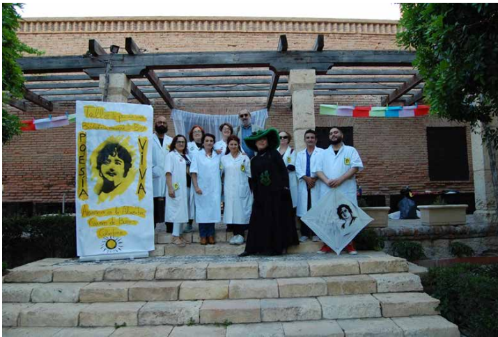
Fotografía 7. Taller Poesía Viva en Amanecer en la Alcazaba (2018)

El taller estuvo en la Universidad de Almería (UAL) dando a conocer sus prácticas de taller y el festival, en las Jornadas Libros, lectura y bibliotecas (2017), dentro de un programa de intercambio que organiza la Fundación Mediterránea.