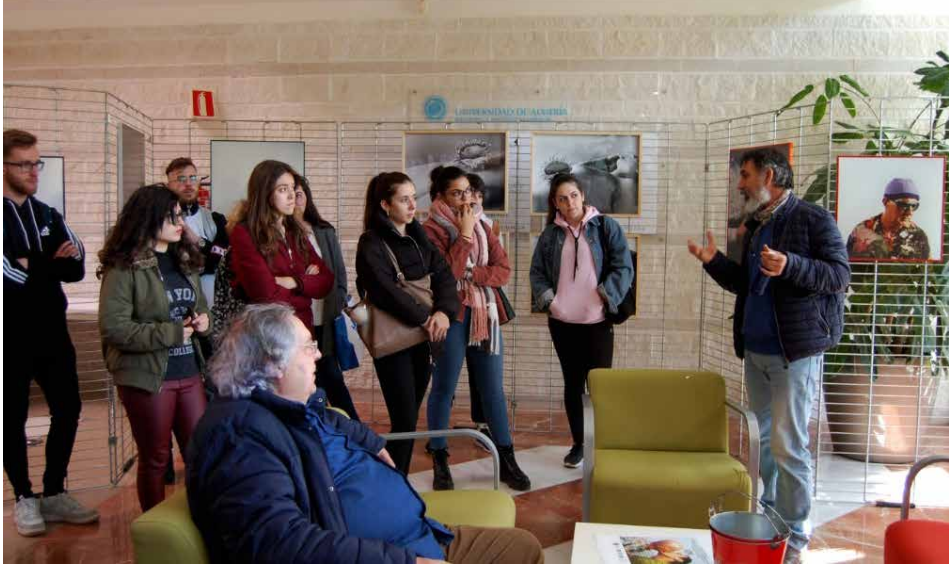
Fotografía 15. *El III Festival (2019) en la Universidad. Homenaje a Juan Hidalgo. Exposición. Biblioteca UAL