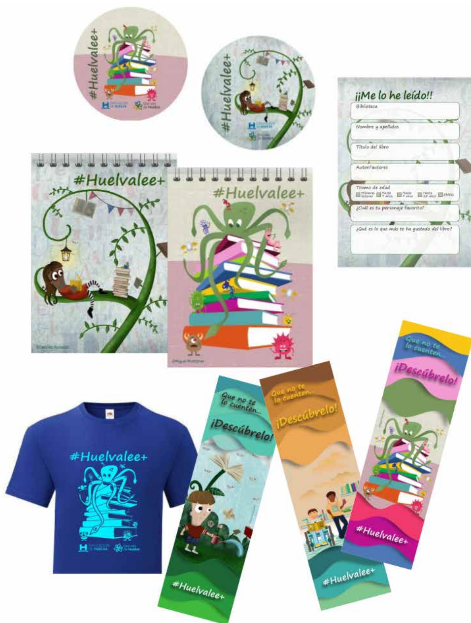
Imagen 2. Incentivos a la lectura.