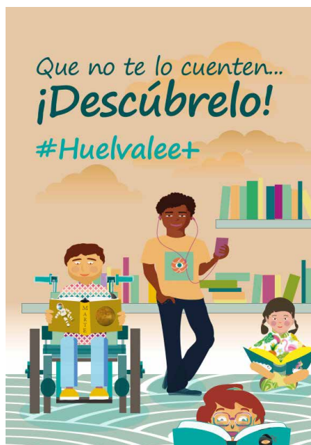
Imagen 1. Cubierta de la Guía