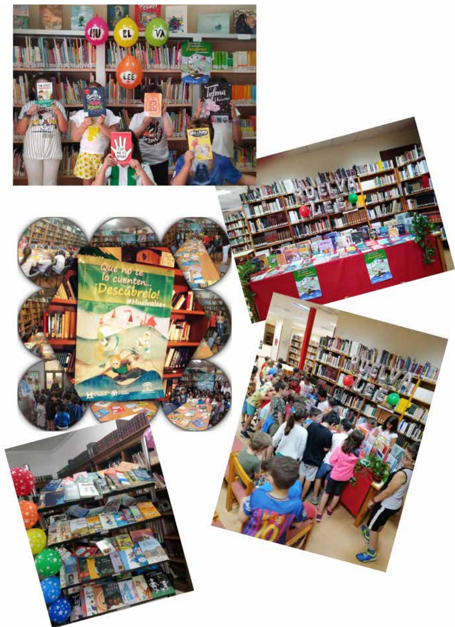
Imagen 3. Presentación del Proyecto #Huelvalee+ en algunos municipios.