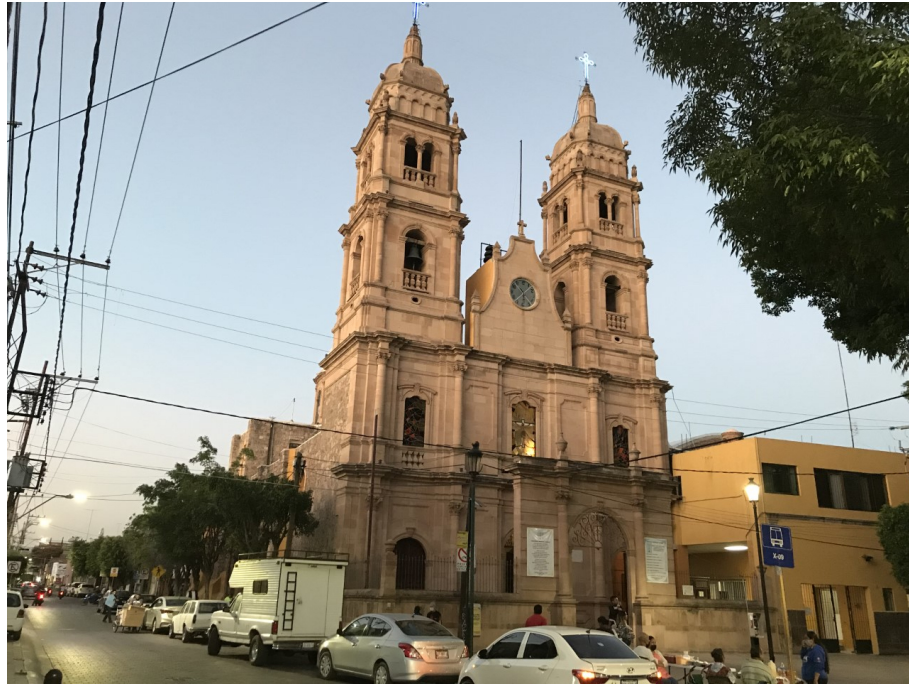
Imagen 2 Templo del Señor de la Salud.

Otro tema que se aborda son los baldíos urbanos y las edificaciones en ruinas que son edificaciones en estado de deterioro, la problemática de la restauración, así como la proliferación de insectos y fauna nociva y también depósitos de residuos sólidos.