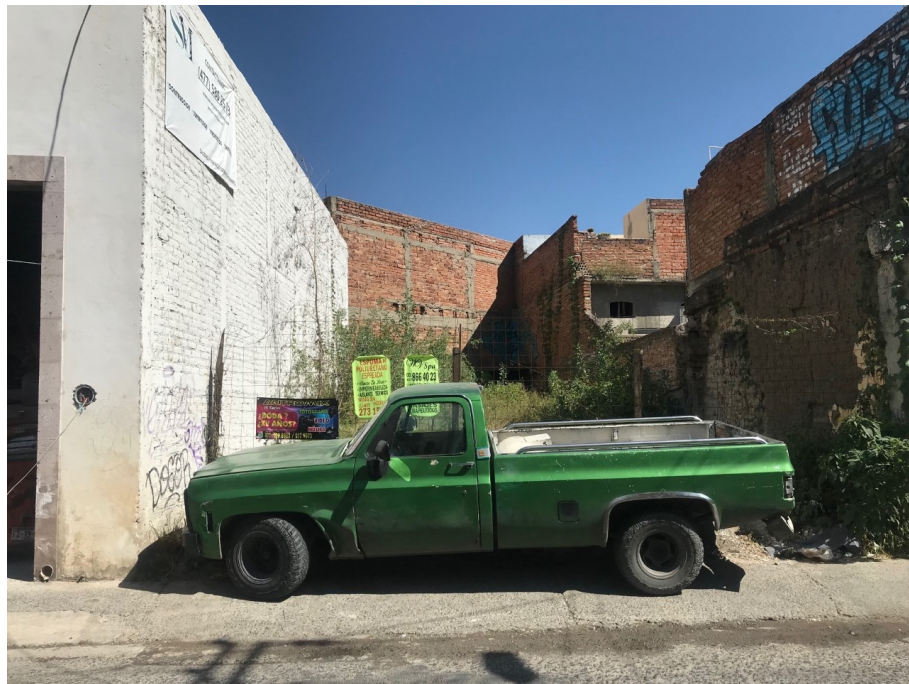
Imagen 3 Baldío urbano en la calle 5 de mayo

Otro tema que se aborda son los baldíos urbanos y las edificaciones en ruinas que son edificaciones en estado de deterioro, la problemática de la restauración, así como la proliferación de insectos y fauna nociva y también depósitos de residuos sólidos.