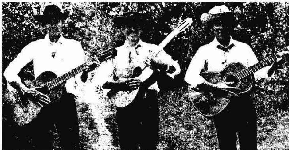
Los Alegres de Occidente. Foto tomada de la carátula del disco del mismo título Fonobosa LPF-50.081 (1982) Bogotá.

Exista una relación entre el nombre que escogen para el grupo y el merengue, con nombres de alegría y fiesta: Los Alegres del Guavio, Los Alegres del Chicamocha, Los Parranderos de Coscuez, Los Alegres de Occidente, Los Ruiseñores del Oriente, Trío los Parranderos, etc.