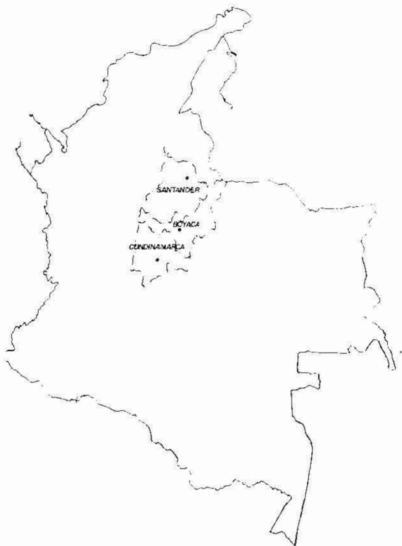
UBICACION DE LA ZONA DE TRABAJO (FIG 1)

Simultáneamente al trabajo investigativo comencé a adelantar un plan de reactivación y de educación musical. Los talleres con los campesinos servían a la vez como trabajo de campo donde ellos enseñaban su cultura y como