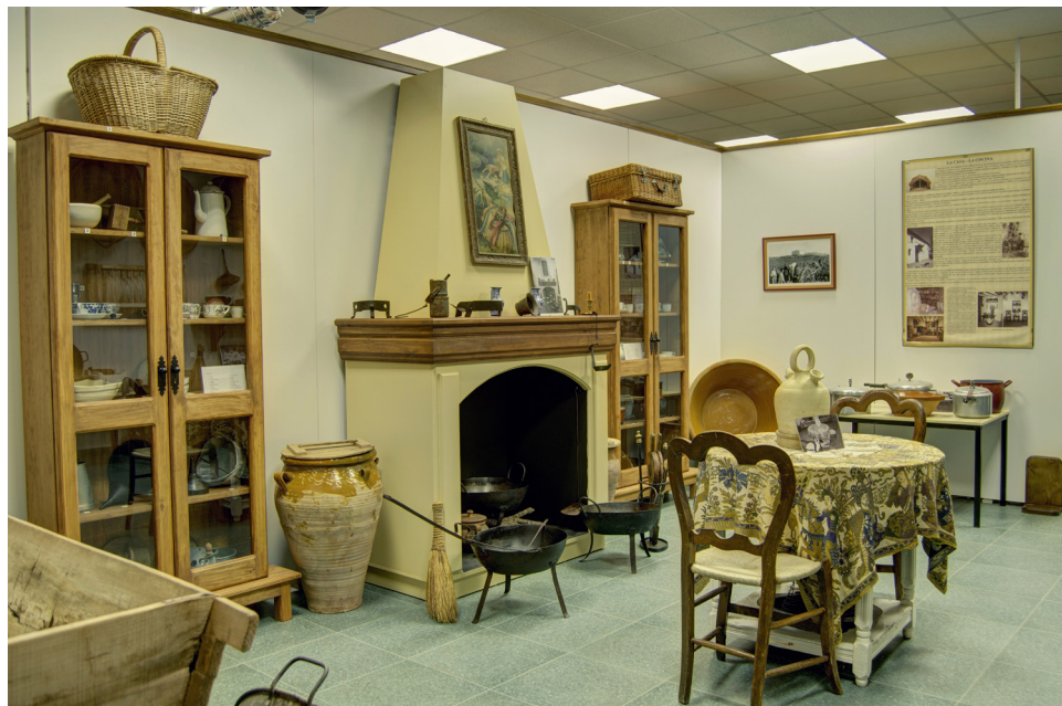
Fig. 4: Vista de la exposición permanente del Museo Etnográfico de Alhambra.

Otro importante reto para la Asociación fue la conformación del Museo Etnográfico. Gracias a las generosas aportaciones de los vecinos, este proyecto vio la luz en 2011 (Fig. 4). La colección incluye diversos útiles, desde los enseres vinculados a las faenas agropecuarias, a otros vinculados a otros oficios, como la carpintería, la forja o los barberos entre otros. También, el Museo incluye diversos muebles, utensilios domésticos, juegos de niños o libros escolares entre otros. Por lo que se puede concluir que tal espacio reproduce los modos de vida tradicional manchega en general, y alhambreña en particular, en un amplio abanico de realidades –ámbito laboral y familiar, marco escolar, ocio, productivo, etc.–, a través de la cultura material propia de la primera mitad del siglo XX.