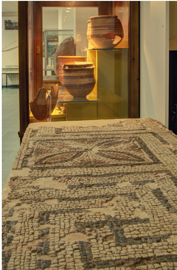
Fig. 3: Vista de la exposición permanente del Museo Arqueológico de Alhambra.

Sin duda alguna, el Museo Arqueológico de Alhambra supuso y supone, uno de los mayores logros conseguidos en la lucha por el patrimonio de la población alhambreña y campomontieleña en su conjunto. Al hecho de contar con unas instalaciones para el disfrute de todos, se suma otro factor aún más importante. Éste corresponde a la concienciación de la población en la necesidad de conservar y proteger nuestro patrimonio, a fin de facilitar la investigación científica, promover en clave cultural y económica el municipio y su comarca y conocer las raíces histórico-cultuales del territorio (Fig. 3).