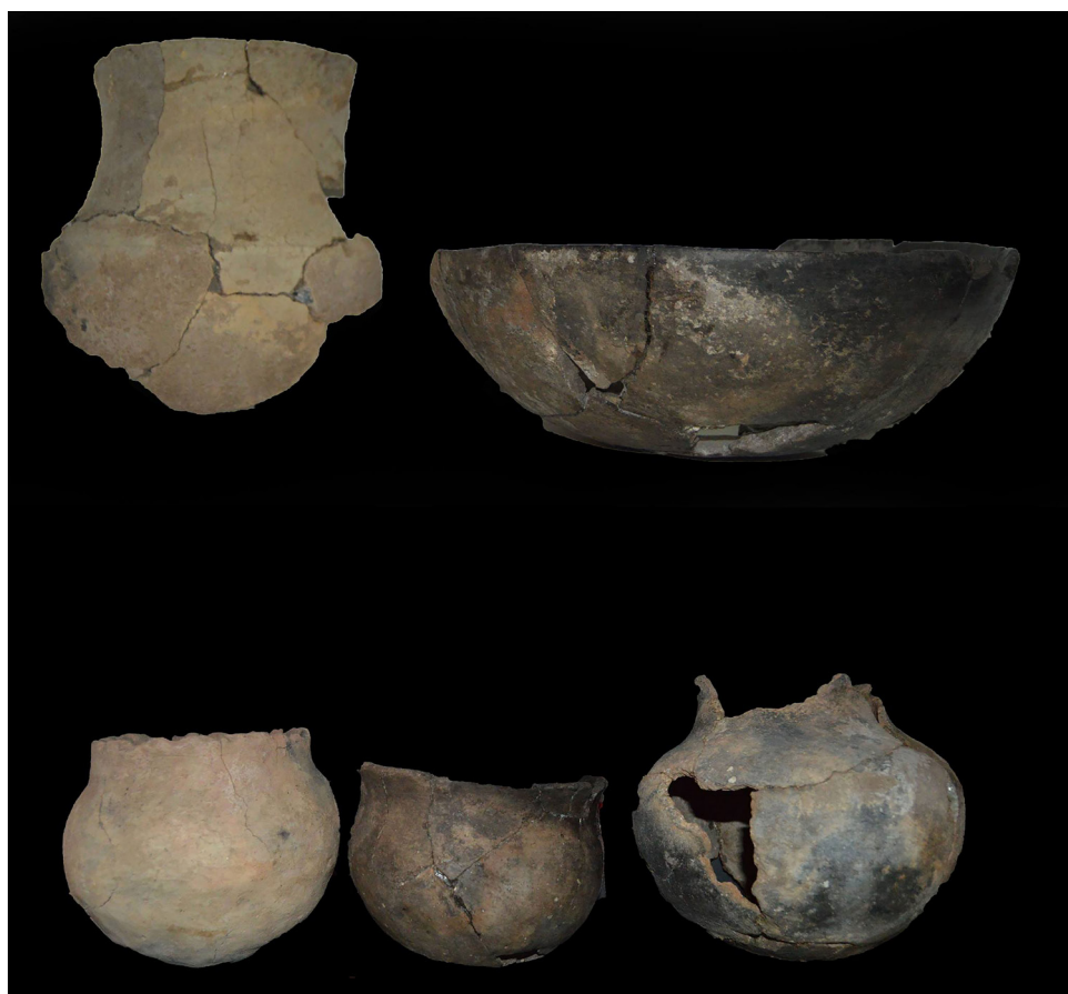
Fig. 9: Vasos cerámicos procedentes de las excavaciones del cerro Bilanero.