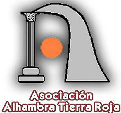
Fig. 1: Logotipo de la asociación.

Alhambra Tierra Roja (Fig. 1) es una asociación sin ánimo de lucro que trabaja para la protección, conservación, puesta en valor y divulgación del patrimonio histórico y arqueológico de la localidad de Alhambra (Ciudad Real). Si bien los objetivos de la asociación son muchos, entre los más importantes, podríamos citar tres: