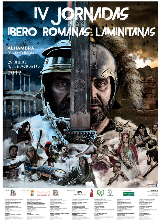
Fig. 7: Cartel divulgativo de las IV Jornadas Ibero-Romanas Laminitanas 2017.