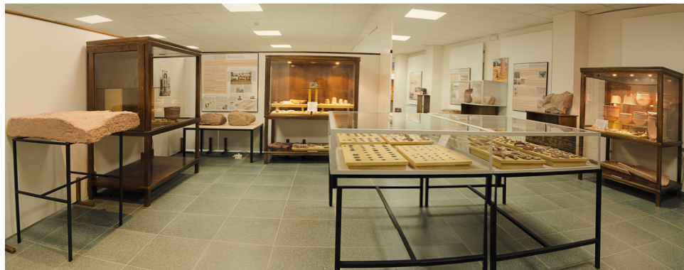
Fig. 2: Vista de la exposición permanente del Museo Arqueológico de Alhambra.

El Museo Arqueológico de Alhambra (Fig. 2) cuenta con más de 900 piezas expuestas, ordenadas cronológicamente desde el Paleolítico a la etapa moderna, y que se podrían diferenciar cuatro salas dentro del Museo 2 , contando además con otras salas complementarias, como la que da recepción al Museo –con una fotografía aérea de Alhambra– o la sala de reproducción de audiovisuales, así como dos almacenes de materiales dentro del mismo edificio. Toda la colección cuenta con