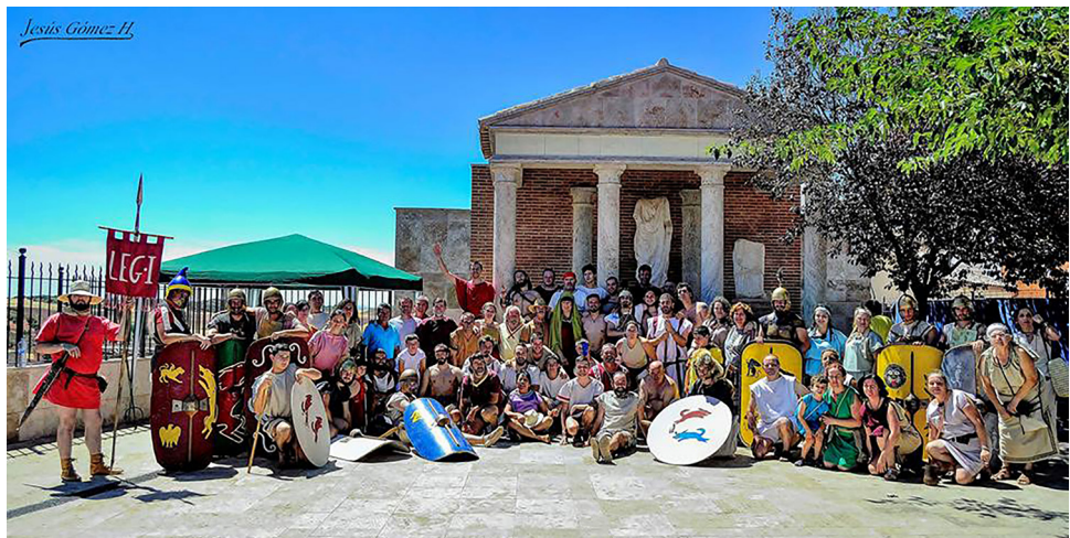
Fig. 8: Foto de familia de los grupos recreacionistas participantes en las IV Jornadas Ibero-Romanas Laminitanas 2017.