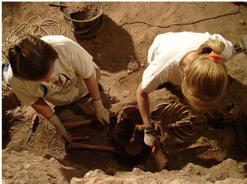
Fig. 5: Momento de la excavación arqueológica promovida por la asociación en el interior de la parroquia de San Bartolomé en el año 2006.