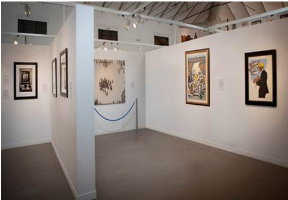
Fig. 3: Museo de Arte Contemporáneo El Mercado (Villanueva de los Infantes)..