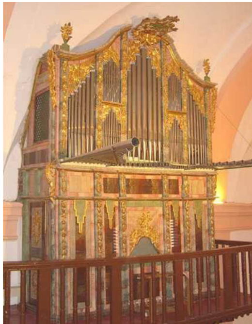
Fig. 4: Órgano de Torre de Juan Abad.