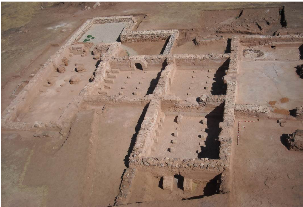
Fig. 1: Yacimiento de La Ontavia (Terrinches).

El Patrimonio supone, entre otras cosas, un recurso que sirve tanto a la educación formal como no formal para reforzar valores de identidad, así como actitudes de tolerancia hacia otras culturas y formas de vida. También su conocimiento será útil para el desarrollo de una conciencia histórica, ya que interrelaciona fenómenos del presente y pasado) o también promueve actitudes acordes con la defensa de los derechos humanos.