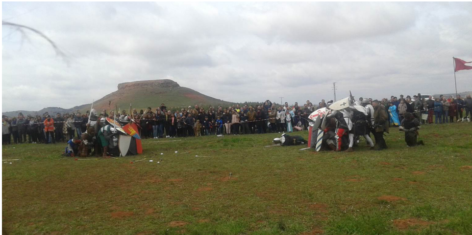
Fig. 2: Recreación de la batalla de Montiel (Montiel).

La característica más destacable, sobre todo en esos 21 pueblos, es el creciente y constante despoblamiento, así como el envejecimiento de sus pobladores.