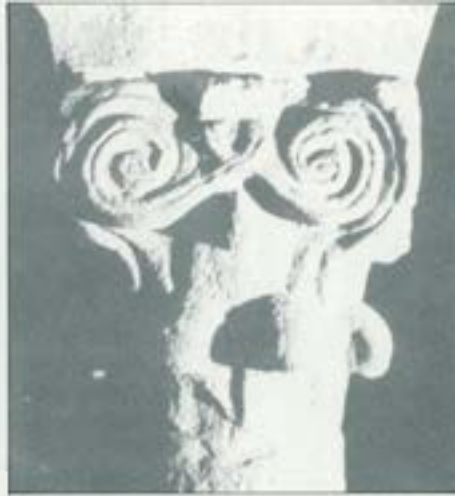
Capitell reaprofitat de la cripta de Vic.