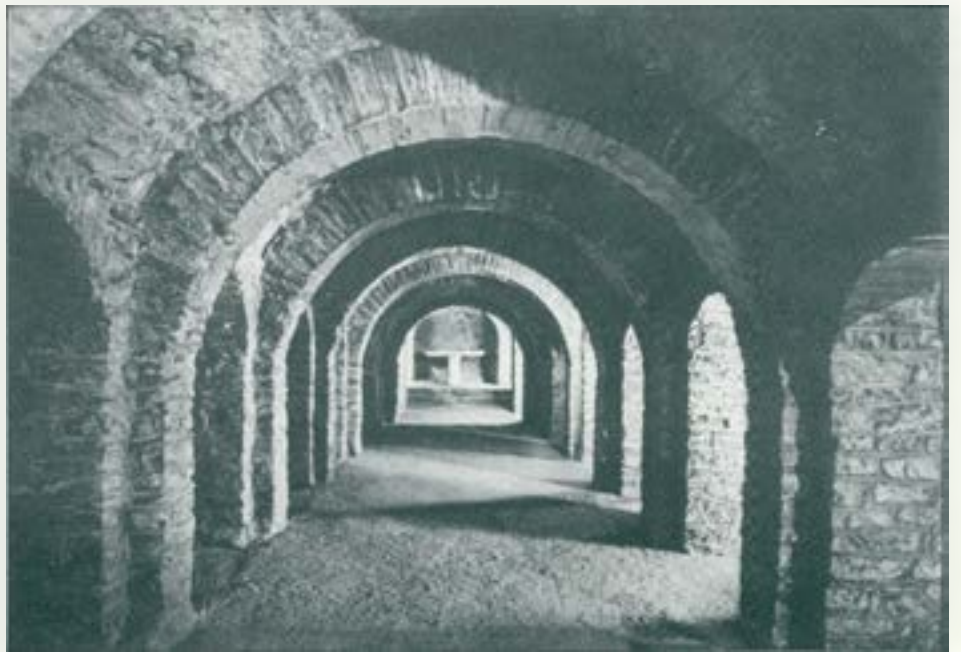
Sant Miquel del Canigó; església inferior.

La construcció de criptes no s'acabà amb el romànic. En època gòtica encara s'en construïen, dedicades sobretot a la seva primigènia fundació de servir de capelles per la guarda de cossos de sants, com la que es bastí a la catedral de Barcelona, i que encara podem veure avui, destinada al cos de santa Eulàlia. ■