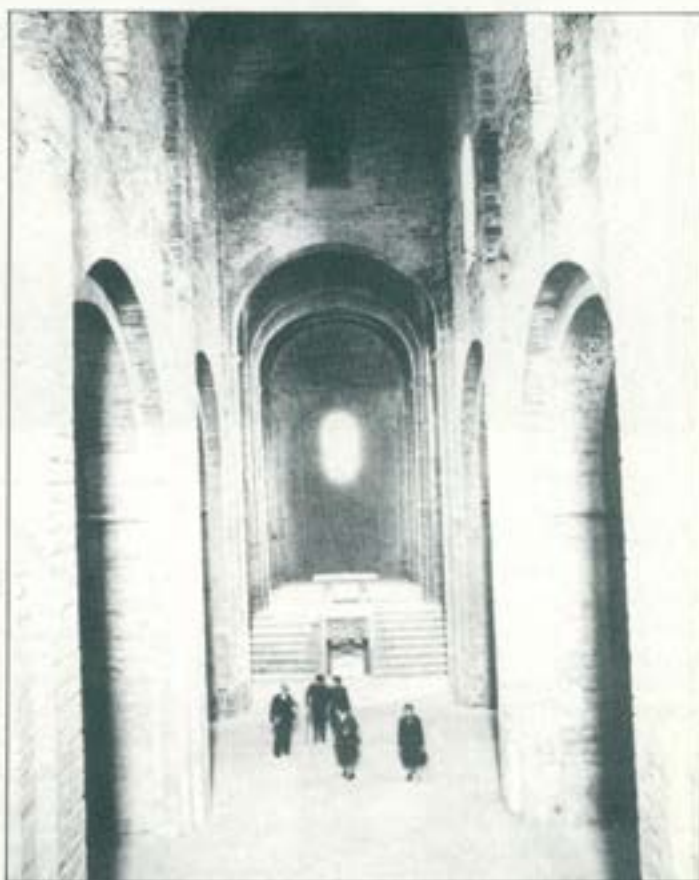
Sant Vicenç de Cardona.