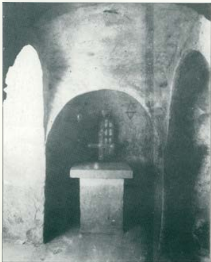
Cripta dedicada a Sant Celoni (Sant Miquel de Terrassa).

Aquesta disposició resolva també la duplictat d'actituds davant dels actes culturals: la intimitat, que s'assolia en les celebracions hagudes dintre de la