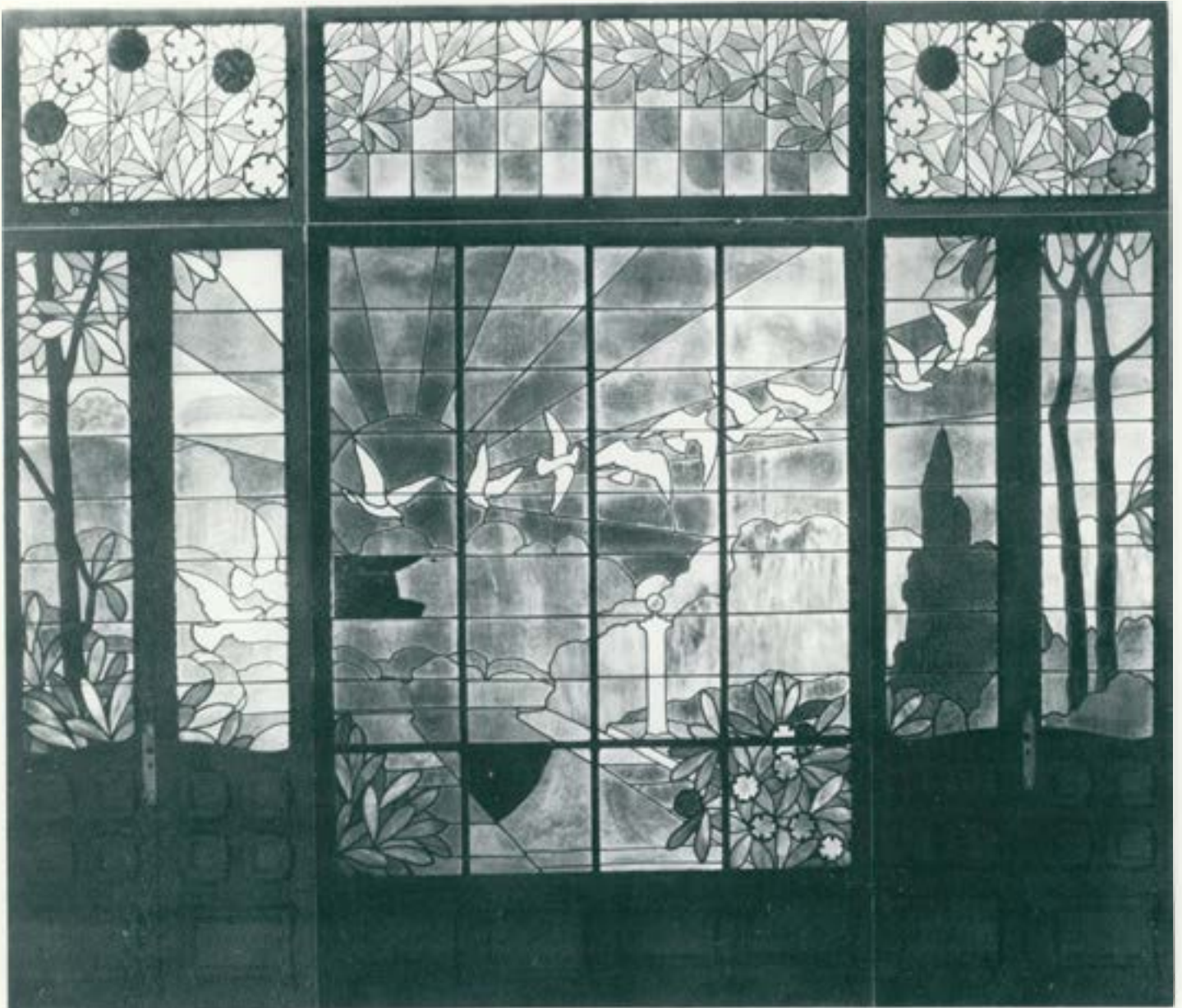
Una de les grans peces del Modernisme a Sabadell.

d'allò que s'havia rebut de fora. Seguirem l'evolució que féu i la maduresa que, amb el pas dels anys, anà adquirint des del ritme de línies, l'estètica de les composicions, fins a l'enriquiment progressiu dels materials emprats. No pretenem, però, fer un resum del que allí es va dir, perquè prou se n'ha escrit i parlat en aquests darrers anys del Modernisme a casa nostra. Sols volíem recordar que degut a l'amplitud de l'exposició i a través de la conferència de què hem fet esment, aquest esdeveniment fou una bona excusa per a recrear-se i descobrir una mica més; i per a altres de retrobar la realitat del que fou i encara és el vitrall modernista català.