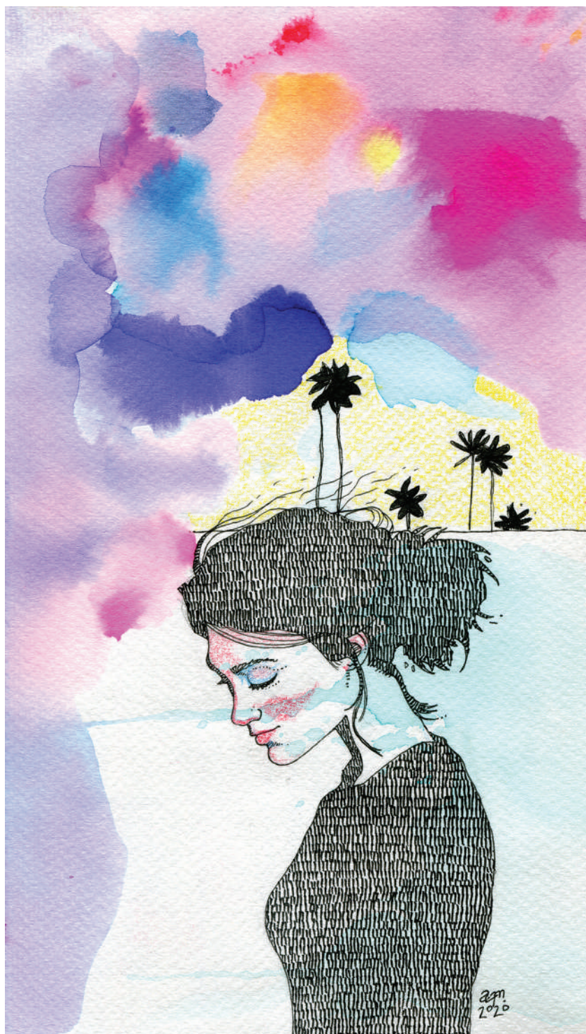
Begonia 2 (2020). Tinta y acuarela: Abraham Morales. Prohibida su reproducción en obras derivadas.