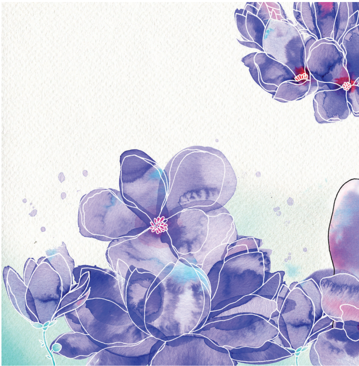
Violeta (2020). Técnica mixta: Abraham Morales. Prohibida su reproducción en obras derivadas.