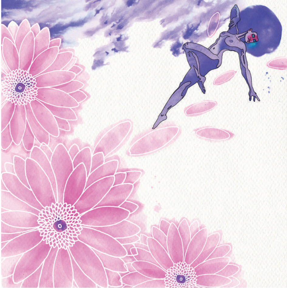
Gerbera (2020). Técnica mixta: Abraham Morales. Prohibida su reproducción en obras derivadas.