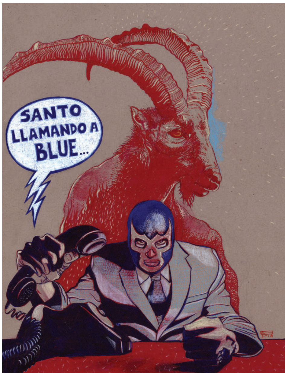
Santo llamando a Blue (2020). Técnica mixta: Abraham Morales. Prohibida su reproducción en obras derivadas.