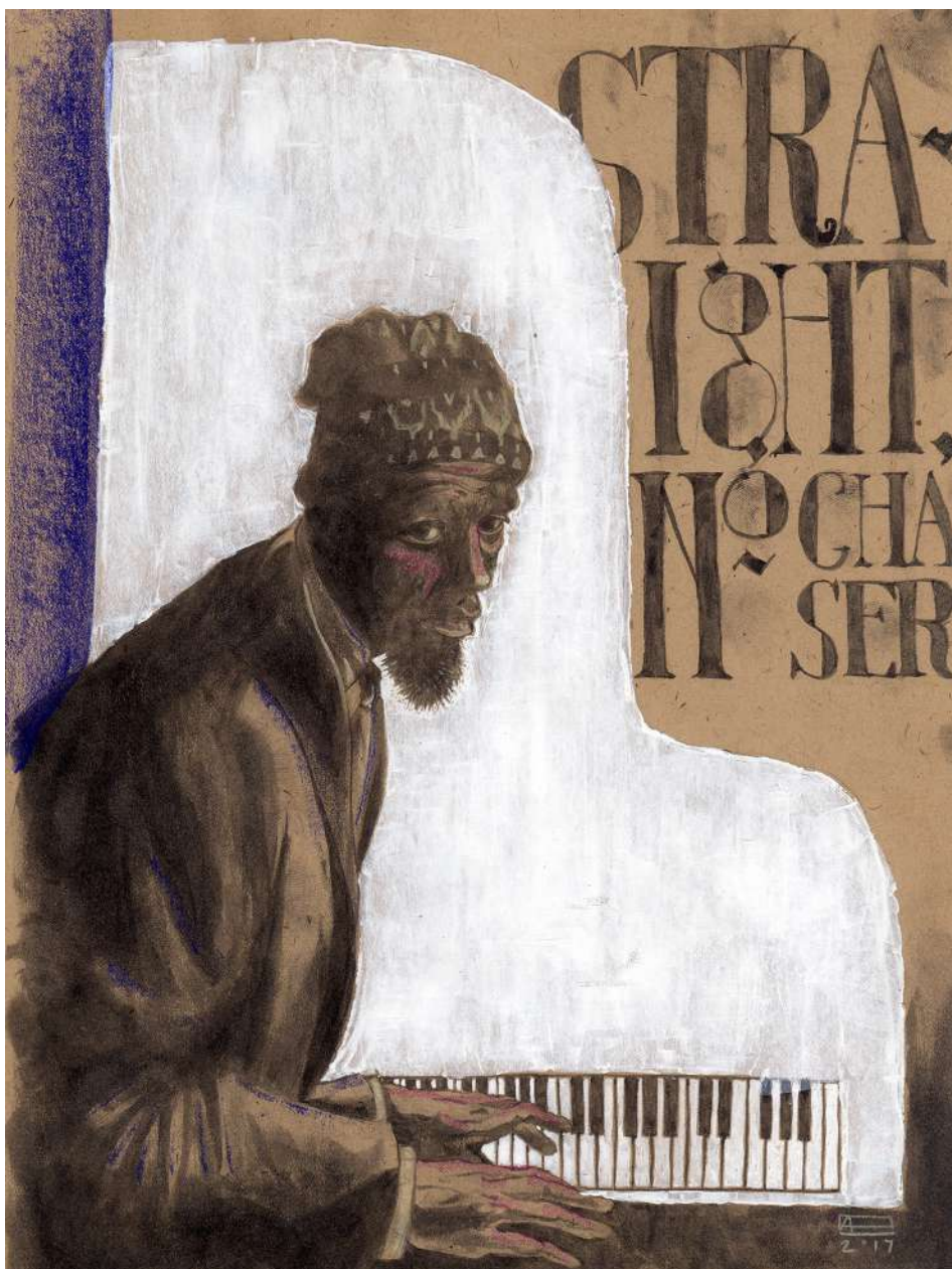
Straight No Chaser (2017). Técnica mixta: Abraham Morales. Prohibida su reproducción en obras derivadas.