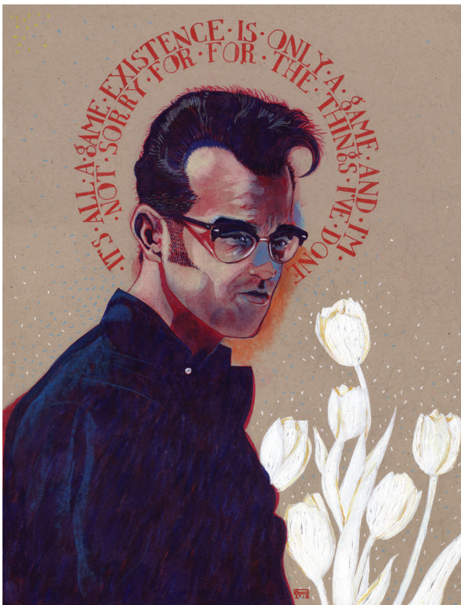
Morrissey (2020). Técnica mixta: Abraham Morales. Prohibida su reproducción en obras derivadas.