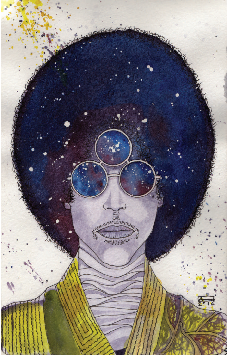
Prince (2016). Tinta y acuarela: Abraham Morales. Prohibida su reproducción en obras derivadas.