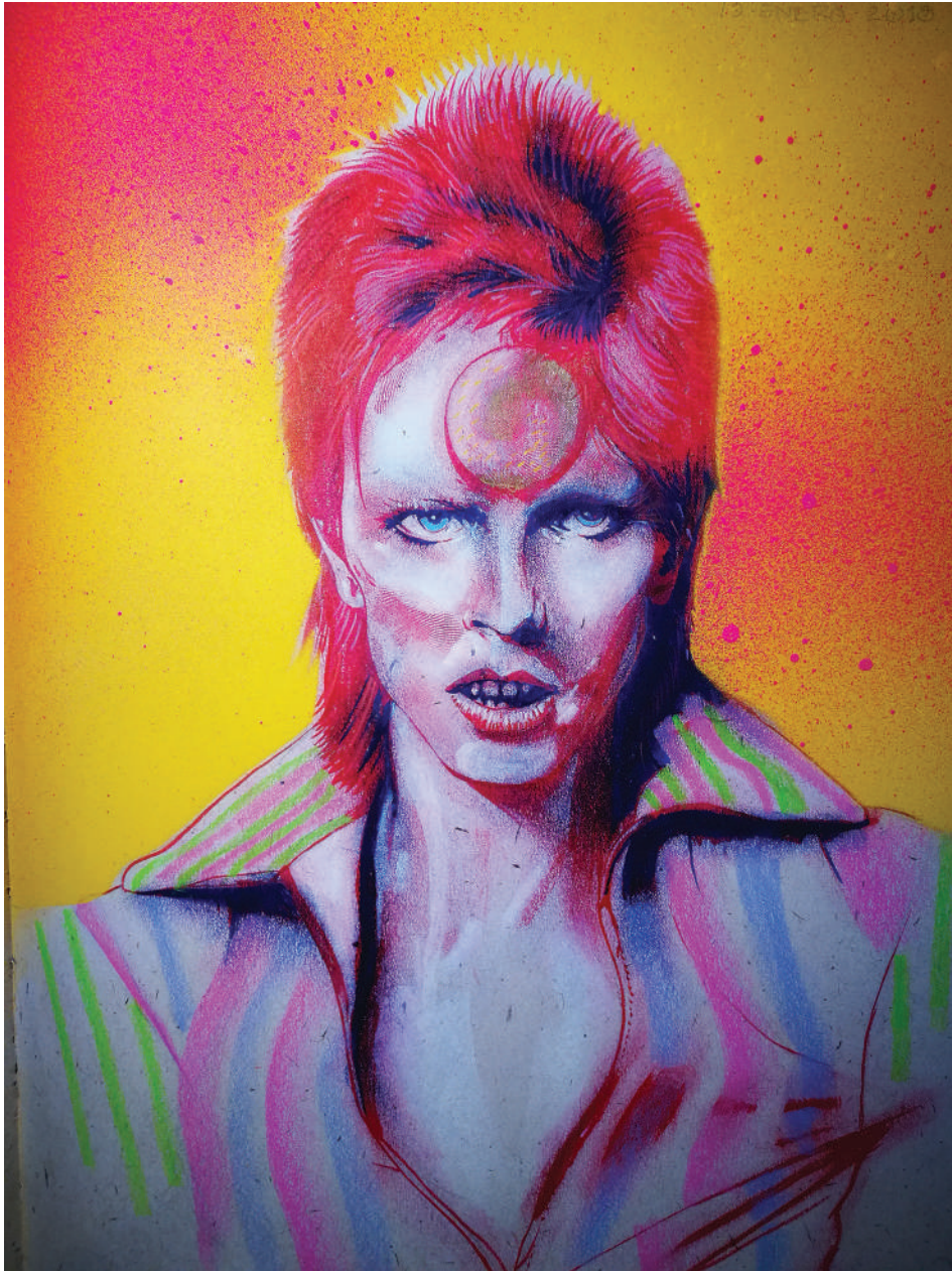
Ziggy (2017). Técnica mixta: Abraham Morales. Prohibida su reproducción en obras derivadas.