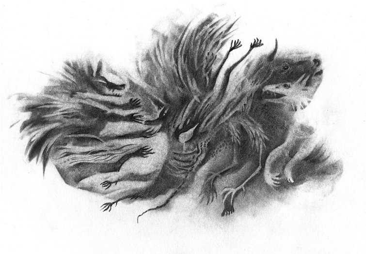
Lobos y aves (2016). Lápiz: Carlos Alberto Badillo-Cruz. Prohibida su reproducción en obras derivadas.