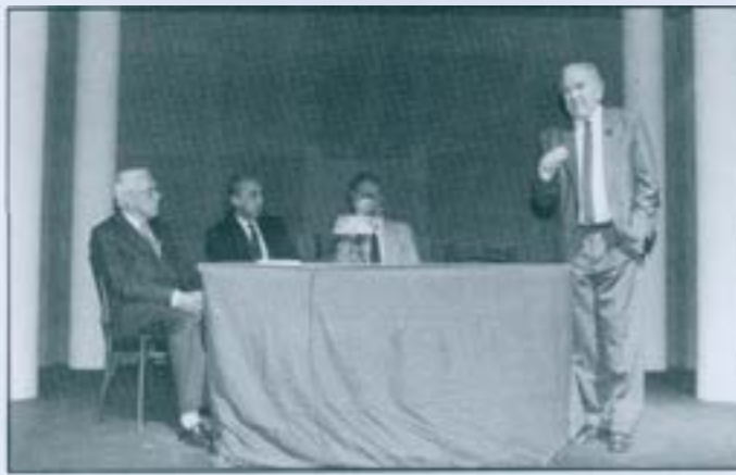
El crític, actor i director Frederic Roda pronuncia una distesa xerrada amb el títol "Comentari d'entreacte"