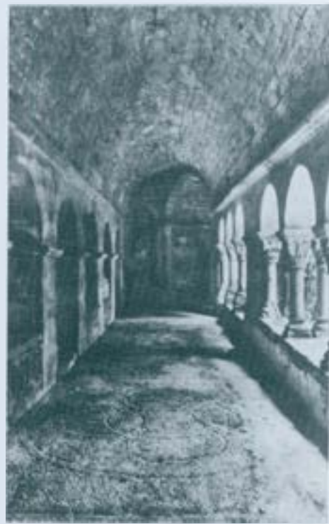
Claustre de Sant Benet de Bages.

D'època incerta també són els paviments de còdols col·locats formant dibuixos geomètrics. Són corrents al Pallars, sobretot a la vall d'Aneu i a les adjacents, com les de Cardós i Ferrera; n'hi ha també a la nau de la mateixa església d'Alaó que té al presbiteri el mosaic d' opus sectile abans esmentat; i en molt altres llocs, el claustre de Sant Benet de Bages un d'ells. No tots aquests paviments de palets són romànics, ja que la seva és una tècnica que no és típica d'un moment artístic, sinó que es perllonga en el temps; i que s'ha utilitzat i s'utilitza encara en molts altres usos, com poden ser la pavimentació de