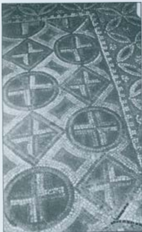
Sant Pere de Terrassa.

Si bé el sòl de la majoria d'esglésies romàniques estava format per una simple capa de morter, imitant en certa manera el picadís romà, o bé per un enllosat de pedra, i fins i tot sense res, només amb la terra batuda, s'han trobat restes de paviments més nobles, com poden ser els de còdols formant uns dibuixos geomètrics, i encara més rics com són els formats per