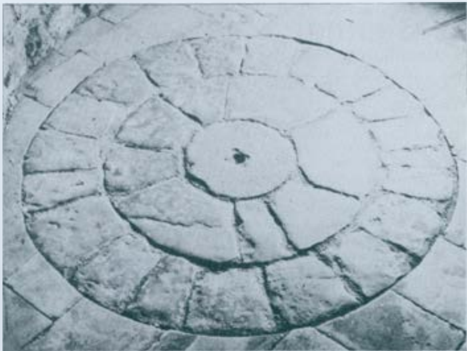
Cripta de la Catedral de Vic.

També del segle XIIè deuen ser uns mosaics fets no amb teselles sinó amb opus sectile , això és amb trossos de pedra tallats segons dibuix i color. Ens referim a uns que hi ha a la cripta de la catedral de Vic, pràcticament monocolors, i uns altres, amb fort colorit, al presbiteri del monestir d'Alaó, a Sopeira. El tema decoratiu d'ambdós és semblant: uns cercles concèntrics, amb una peça rodona al mig i unes corones circulars dividides en sectors pràcticament iguals que l'envolten.