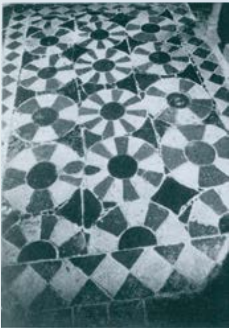
Santa Maria d'Alaó.

També era un mosaic de teselles el que hi havia a Ripoll i que malauradament es perdé quasi del tot. Se'n féu però un dibuix i se'n conserven uns petits fragments: estava format per un conjunt de cercles que incloïen uns animals fantàstics; sota els cercles, com fent-los-hi suport, hi havia dos grans dofins. La seva