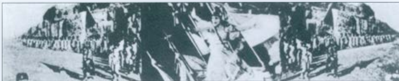
La triple pantalla del "Napoleó" d'Abel Gance (1926)

obligar a tancar les sales d'espectacles fins que s'hi haguessin dut a terme unes millores de consolidació i d'higienització que es consideraven imprescindibles. El tancament va fer-se el 19 d'abril del 1930. Justament en aquella temporada cinematogràfica que s'acostava a la fi, tots els locals de prestigi de Barcelona i de moltes altres poblacions catalanes s'havien avançat als de Sabadell en la instal·lació d'equips per al cinema sonor. El mateix mes del tancament de les nostres sales s'havia projectat a l'Imperial, encara en mut, el film que va constituir l'impacte mundial del cinema sonoritzat: "El loco cantor". Havia de ser, però, la mateixa Cinaes, en el seu cine Imperial, qui trenqués el glaç. Per la Festa Major del 1930, l'u d'agost, superada la quarantena governativa, l'Imperial oferia al públic sabadellenc un film sonor de gran espectacle: "Broadway Melody". I l'octubre del mateix any el combinat Euterpe-Camps-Cervantes estrenava també les seves instal·lacions sonores.