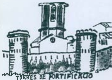
Dibuix de Marià Burgués

P ere Roca i Garriga, en la seva ponència "Les muralles de Sabadell", llegida a la Fundació Bosch i Cardellach el 26 de gener de 1963 i publicada el 1972 en "Quaderns d'Arxiu" núm. 22, diu: "Algun indici referent a l'existència de torres a les nostres muralles, sí que existeix" (p.12) "L'existència de torres al llarg de la muralla és, com hem dit abans, quelcom que no ha quedat encara ben clar i que preocupava de debò Bosch i Cardellach" (p.19).