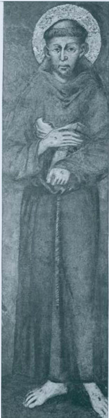
Genni di Pepo, Cimabue: "Sant Francesc", S. XIII (Mural. Fresc. Basílica de Sant Francesc, Assisi. Església inferior).