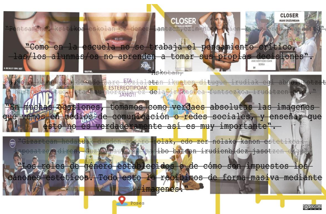
Figura 3. Trabajos y reflexiones del alumnado (2020). Poses.

expuestos. Otra de las reflexiones que habitualmente surge en los debates grupales es la ausencia que hasta el momento han tenido de referentes artísticos femeninos que les permitan entender el uso del cuerpo en la imagen desde una perspectiva más amplia, así como la importancia de transmitir ejemplos de mujeres artistas a sus futuras/os alumnas/os.