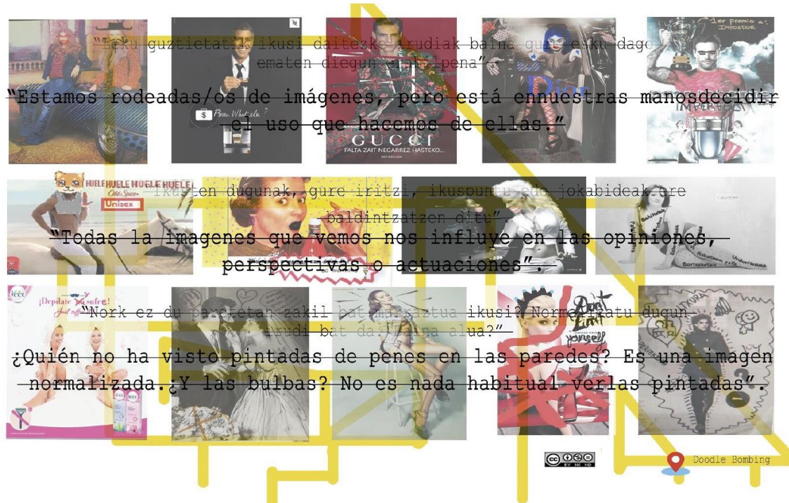
Figura 1. Trabajos y reflexiones del alumnado (2020). Doodle bombing .