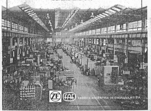
FABRICA ARGENTINA DE ENGRANAJES S.A.