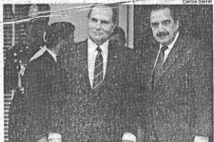
Alfonsín en su reunión de ayer con Mitterrand.

Tanto uno como otro presidente profundizaron durante esta segunda reunión sin otra presencia que la traductora oficial del idioma, aspectos que ya habían abordado en los discursos que pronunciaron la noche del martes en el agasajo, en el que el gobierno argentino le brindó a Mitterrand y a su comitiva en el Consejo Deliberante.