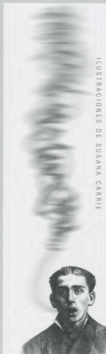
ILUSTRACIONES DE SUSANA CARRIE

zación moderna y las informalidades del rebusque urbano; en el que conviven la hechicería con el biorritmo y arraigadas moralidades religiosas con escandalosas liberaciones de la afectividad y la sensualidad. Ante los asombrados ojos de muchos colombianos se hizo por primera vez visible una trama de intercambios y rupturas que, aun con su esquematismo y sus inercias ideológicas, hablaba del modo como sobreviven o se pudren unas formas de sociabilidad, de las violencias que se sufren o con las que se resiste, de los usos "prácticos" de la religión y las tran-