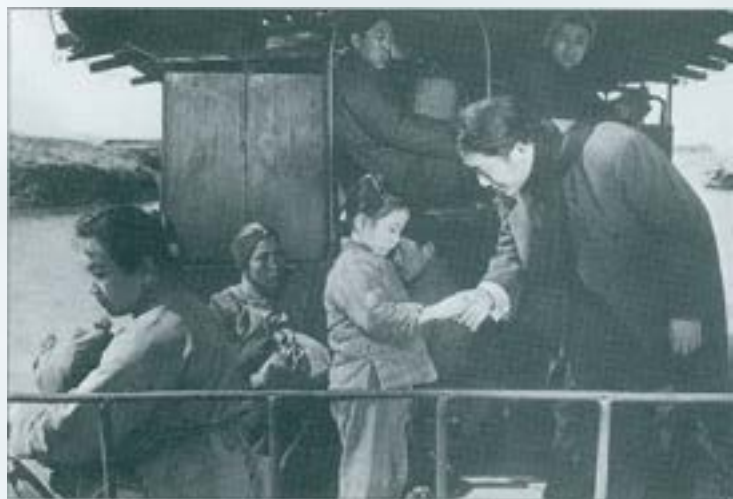
"Primavera primerenca" (1963), de Xie Tieli.

de tercer cicle d'Història de l'Art poguessin dedicar-se a la classificació de materials existents als arxius. Un atzar de feina ha fet que el lot de films examinats, procedents d'una donació desinteressada, fossin precisament científics. No és aquí el moment de fer-ne el catàleg però sí que resulta adient constatar la varietat i riquesa dels materials classificats i resulta trist que no hi hagi qui ho celebri: excel·lents especialistes de la micro i la macro-càmera, muntadors d'una virtuositat aclaparant i directors d'una eficàcia a tota prova, units al servei de les més diverses disciplines científiques i d'especialistes de nivell mundial han demostrat, amb envejable claredat, que el cinema no és només un instrument per a l'ocupació de l'oci. Com a eina de recerca, com a mitjà de constatació de resultats i com a arma didàctica, centenars de milers de kilòmetres de film científic-tècnic bé