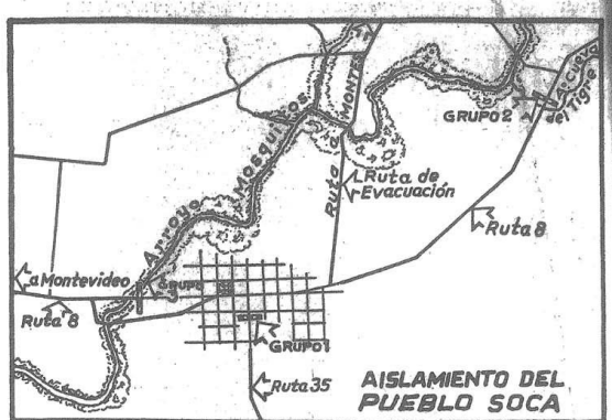
Reconstrucción de El DÍA del estudio aerofotométrico oficial sobre el emplazamiento de los grupos de "Tupamaros" que robaron Soca...