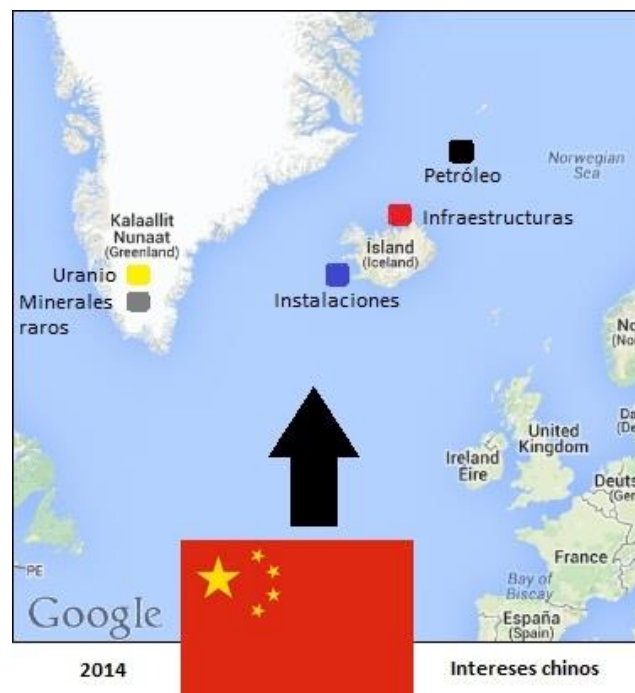
Imagen elaborada por el autor del artículo a partir de Google maps y datos propios.

En dicho proyecto está interesado de forma activa el gobierno chino, tras la oportuna visita a la China Mining Conference – celebrada en Tianjin del 2 al 5 noviembre de 2013 - por parte del Ministro de Industria y Minerales de Groenlandia, así como de varios presidentes de empresas mineras.