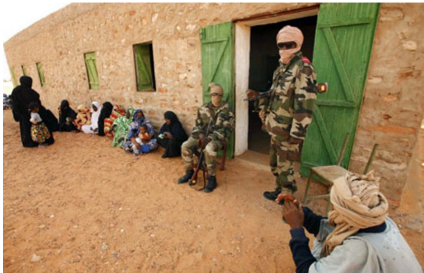
Colegio electoral en el interior del país

El FNDU continuó con las protestas y movilizaciones, denunciando la incapacidad del gobierno para proporcionar unas garantías mínimas de transparencia electoral, así como por la decisión unilateral de seguir adelante con las elecciones a pesar del colapso del proceso de diálogo con las fuerzas opositoras denunciando, al igual que en las elecciones parlamentarias y municipales de 2013, el carácter "dictatorial" de la política del Presidente Abdel Aziz y llamando a boicotear los comicios, a los que consideraban "una mascarada electoral" organizada de forma "unilateral".