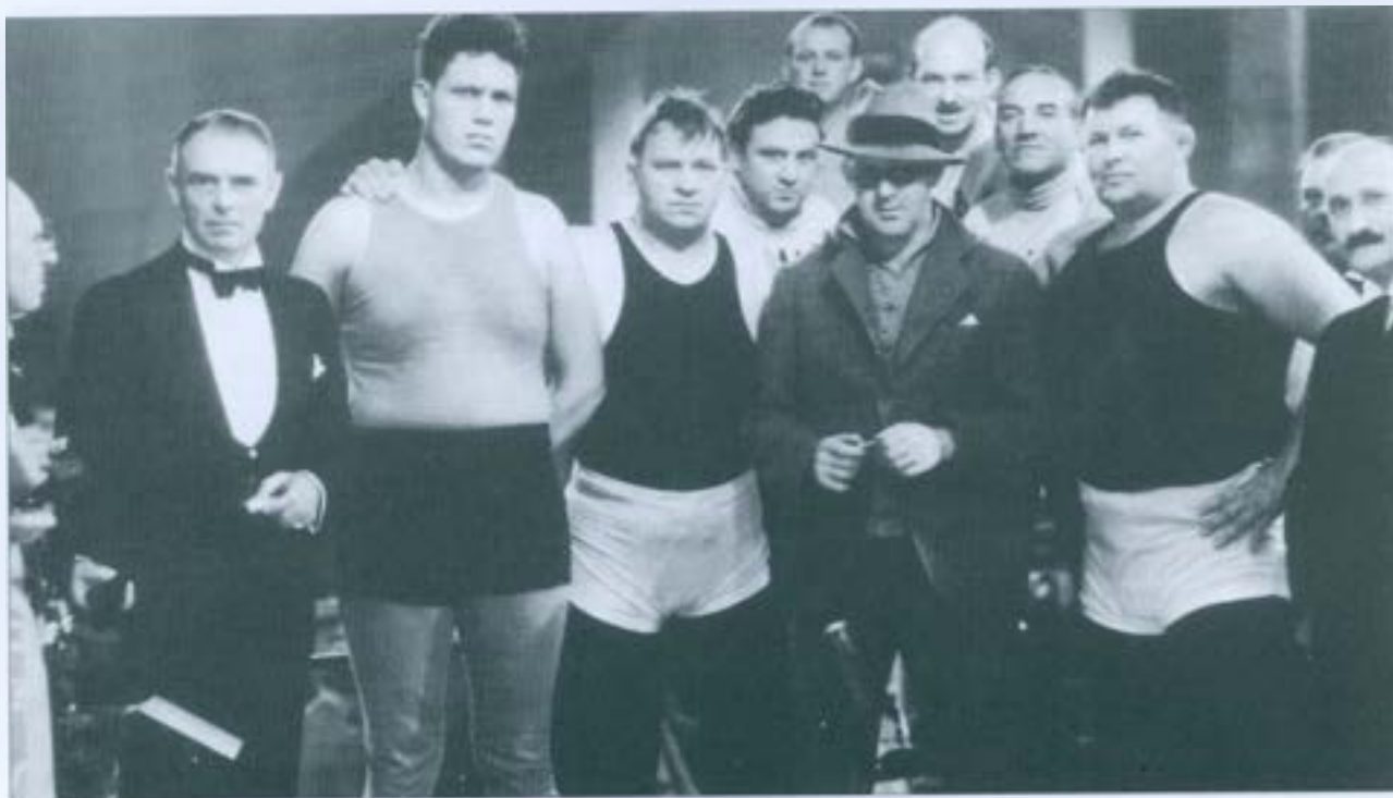
Ford i Wallace Beery enmig d'altres actors de FLESH.

És sabut que, a més dels seus dos grans temes –l'Oest i Irlanda–, Ford ha conreat els gèneres més diversos, especialment el cinema bèl·lic, però també coses en principi tan allunyades d'ell com el melodrama, el film de boxa o el policíac de presons. Si THE PRISONER OF SHARK ISLAND (1936, Prisonero del odio) –vista a la televisió no fa massa temps– és un exemple del darrer cas, FLESH ho és dels altres dos: encara que amb bastants apunts còmics, se'ns presenta, de fet, com un melodrama de