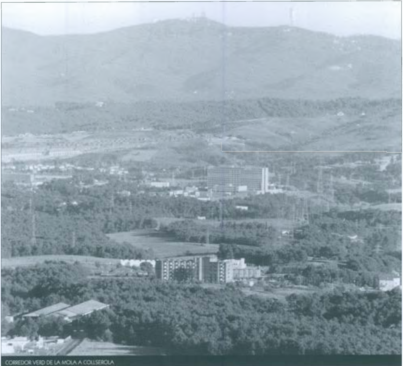
CORREDOR VERD DE LA MOLA A COLLSEIOLA

Quirze del Vallès, on s'ha apostat explícitament per la Via Verda com una de les directrius fonamentals del seu model urbà. Queda però molt per fer, sobretot en tots aquells aspectes que determinen la gestió real i quotidiana d'aquest territori.