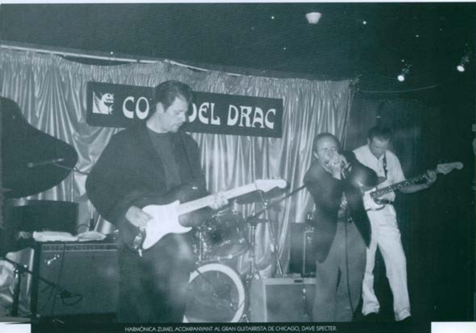
HARMÒNICA ZUMEL ACOMPANYANT AL GRAN GUITARRISTA DE CHICAGO, DAVE SPECTER

Com ens podem imaginar, això no era gens fàcil; tot i haver músics amb una qualitat contrastada, hem de tenir present que no és el mateix tocar Roc o Jazz amb una guitarra, per posar un exemple, que fer-ho en clau de Blues, doncs s'ha de tenir un "feeling" diferent per manifestar musicalment tot allò que tu portes dins.