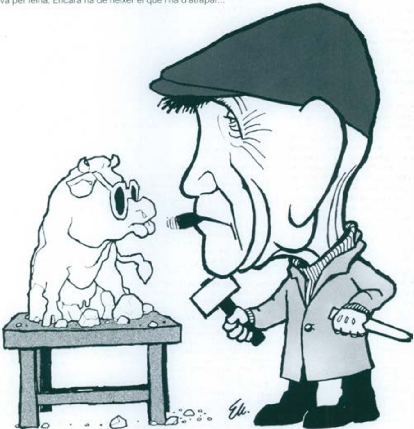
Del llibre "62 Ceballuts", de la Biblioteca Quadern (1984)