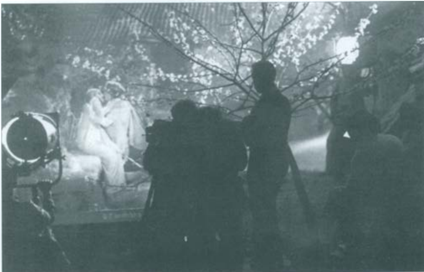
Foto del rodatge de Faust

togràfics i des d'altres pròpiament artístics i històrics.