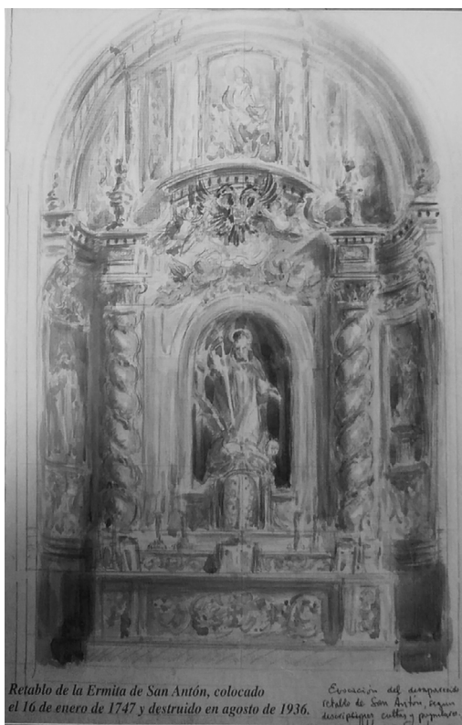
Recreación del retablo de la ermita de San Antón, por Muñoz Barberán

habían ejercido con sumo beneficio de los fieles cristianos la atención a los pobres menesterosos, señaladamente a los que padecían el «fuego de San Antón». Sin embargo, posteriormente habían perdido el afecto y devoción que les profesaban los fieles y habían disminuido los profesos de esta religión. También, que la mayor parte de sus miembros eran laicos, que vivían muchos de ellos casi todo el año lejos de sus casas, para pedir limosna, y no eran suficientes para mantener en las casas la disciplina regular y la hospitalidad propia de la Orden, y que carecían de recursos económicos para ello 45 .