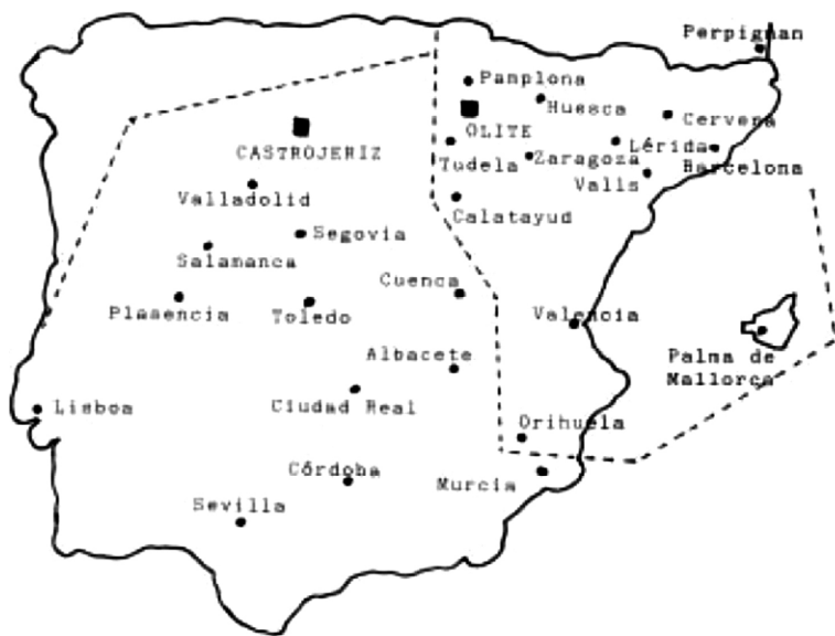
Mapa de las encomiendas, casas y hospitales Antonianos en la Península Ibérica, por Sánchez Domingo.

La referencia más antigua encontrada la ofrece el licenciado Francisco Cascales cuando aborda la historia de los Agustinos. Indica en su celeberrima obra que «éstos solicitaron permiso al concejo de Murcia para fundar un convento, en 1397, entre la puerta de Molina 27 , y la ermita de San Antón» 28 . En origen era conocida como ermita de San Lázaro, cuya fundación hizo el deán de la Santa Iglesia Catedral Martín de Selva 29 .