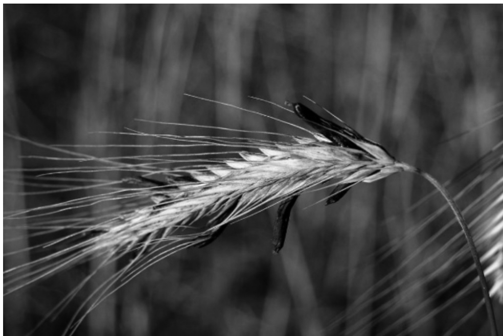
Espiga de centeno afectada por el hongo Claviceps purpurea