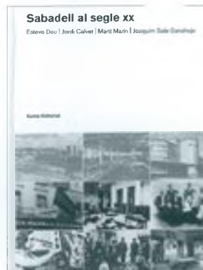
Sabadell al segle XX. E. Deu, J. Calvet, M. Marín, J. Sala-Sanahuja. Eumo Editorial. Abril 2000.

"En un moment donat de la teva existència, quan ja et resta menys temps per recórrer el que portes a les espalles, a voltes t'atures, mires endarrera i contemples la senda en la distància del temps. I fas com una mena de balanç. I et vénen a la memòria, desordenadament, una sèrie de vivències i de records que t'han fet companyia al llarg de la teva vida. I penses que els podries posar una mica en ordre i deixar-ne constància escrita, ni que sigui per tu mateix, dels avatars i les experiències que ens va tocar viure, dintre del protagonisme anònim, als de la nostra generació".