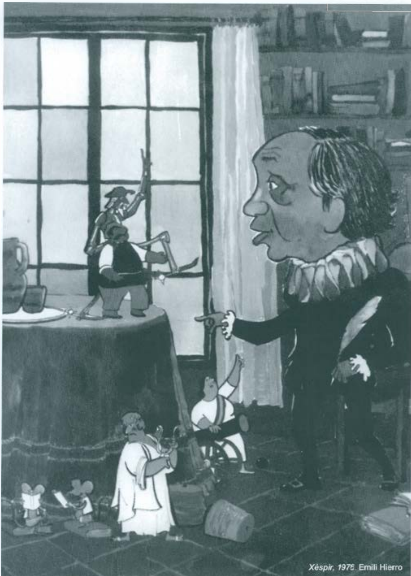
Xèspir, 1976. Emili Hierro