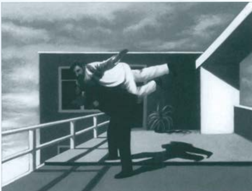
Los desequilibrados , 1997. Gonzalo Sicre.

Ara bé, en filosofia, la realitat és l'essència, "allò que una cosa és, al marge de l'aparença amb què es presenta als sentits". Per tant, el realisme