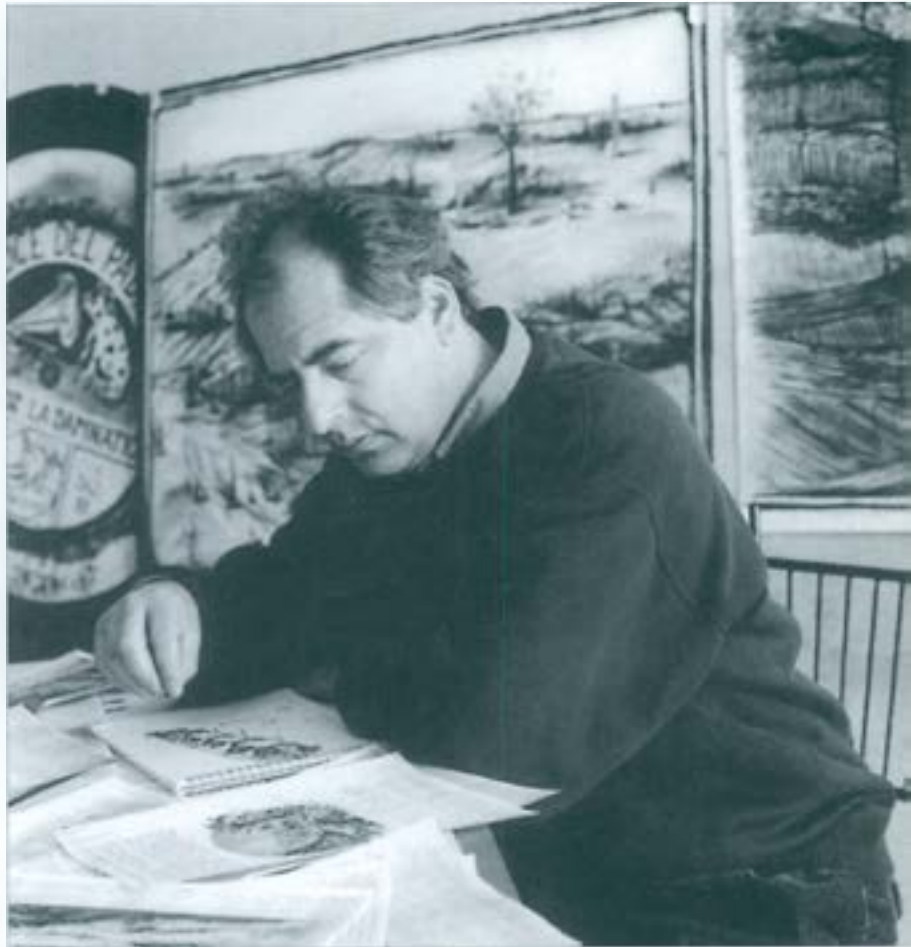
William Kentridge al seu estudi

Kentridge és descendent de lituans i alemanys jueus. El seu besavi matern va emigrar a Sud-àfrica just abans de la guerra dels boers a finals del segle XIX, fugint dels pogroms de l'Europa de l'est i es va fer professor d'hebreu a Ciutat del Cap. El seu besavi patern, que era chazan (cantant de sinagoga) i shochot (matador ritual) també va viatjar a Sud-àfrica a finals del segle passat i es va canviar el cognom pel de Kentridge.