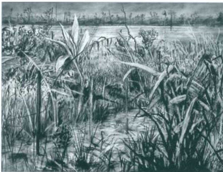
Colonial Landscapes (1995-96) . Carbó i pastel sobre paper, 120 x 160 cm.

sense adulterar en una zona de l'Àfrica on el territori ha estat alterat ecològicament i malmès pel creixement de les explotacions mineres. L'artista contraposa aquestes visions de l'arcàdia amb la realitat d'un paisatge erm, dominat pels detritus miners i per l'enginyeria civil, elements que representen la realitat del pas de l'home i són vestigis històrics de la història de Sud-àfrica. El paisatge apareix com una escena dibuixada o un text mal esborrat que cal recuperar i tornar a llegir. A més, Kentridge contradiu l'ideal del paisatge buit, poblant els seus paratges erms i estèrils amb màquines abandonades i rètols amb seguicis de treballadors que converteixen en visible la població esborrada i segregada.