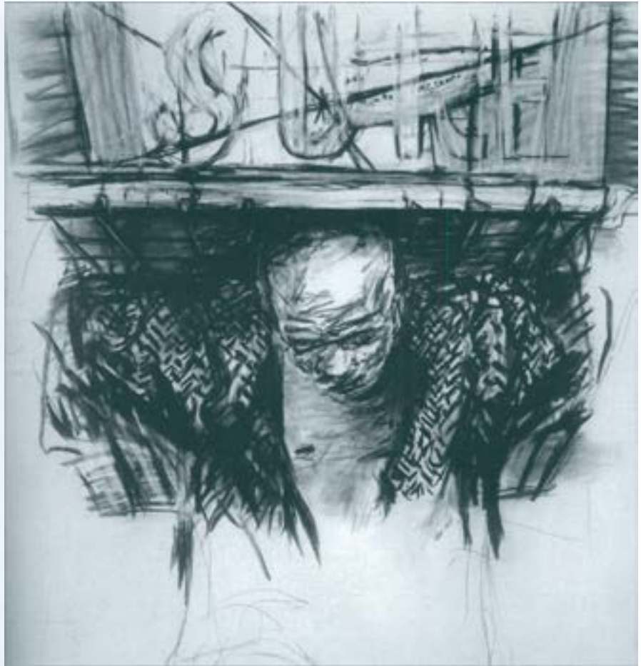
Monument , 1990. Carbó i pastel sobre paper. 150 x 120 cm

Kentridge aborda la incertesa i el procés perquè permeten que el jo s'apropi al món amb humilitat i obert al canvi, més que no pas amb concepcions prèvies i autoritat.