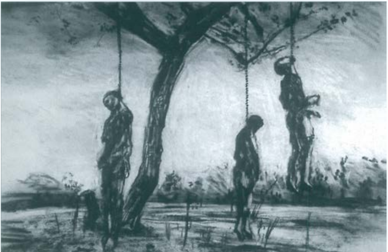
Faustus in Africa! 1995. Carbó sobre paper. 53 x 85 cm.