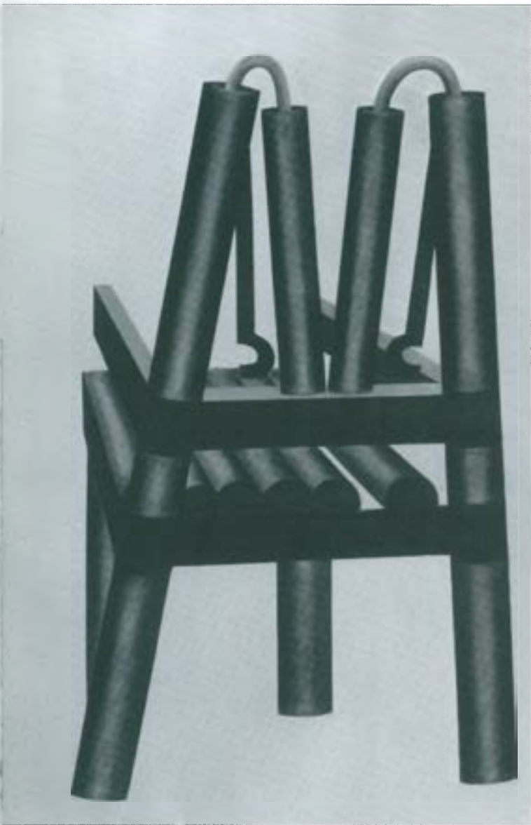
Elegia a l'amor