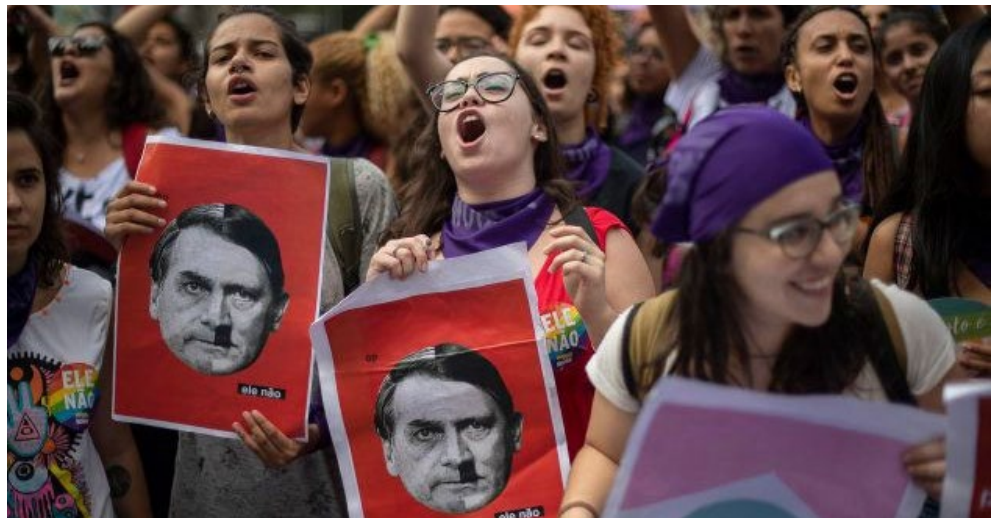
Imagen 1. Comparación entre Jair Bolsonaro y Hitler. Huffpost , 2018. 7