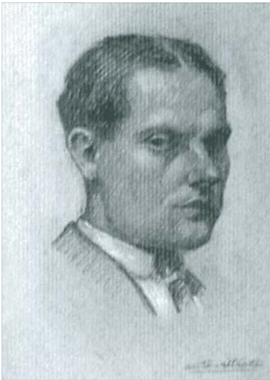
Autoretrat, 28 d'abril de 1916

compte que les primeres dècades del segle vint es corresponen amb les de les noves avantguardes i, aquestes, per als joves que comencen, eren múltiples i molt polaritzades. A l'anvers d'un d'aquests dibuixos, l'artista demanava l'opinió de la seva amiga sobre el canvi de firma que havia fet i on totes les lletres apareixien en majúscules. Rúbrica que, al llarg de la seva trajectòria, tan sols utilitzarà en comptades ocasions.