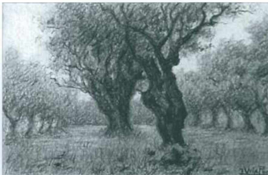
Paisatge. 29 de març de 1916