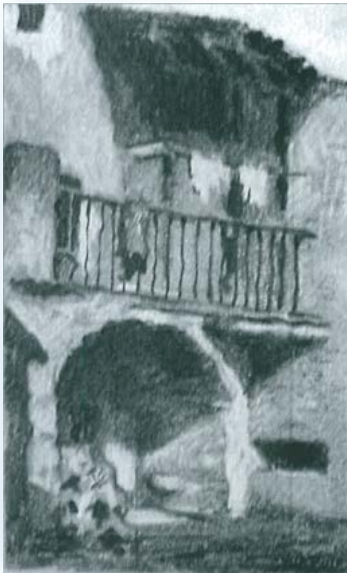
Porta del Paisatge rural. 18 de gener de 1916