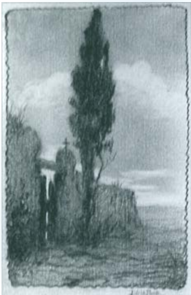
Cementiri de Santa Pau de Riu-Sec. 13 de març de 1916