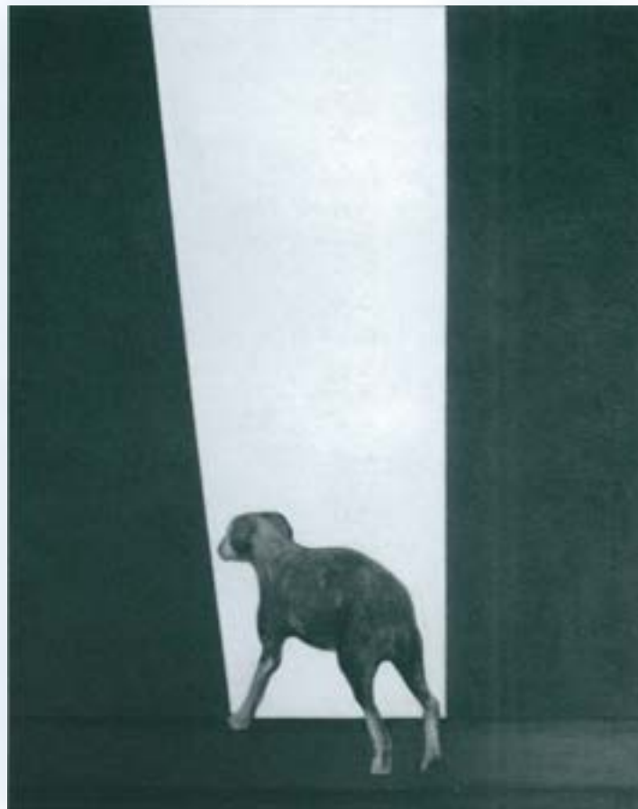
"Allí" (oli sobre tela)