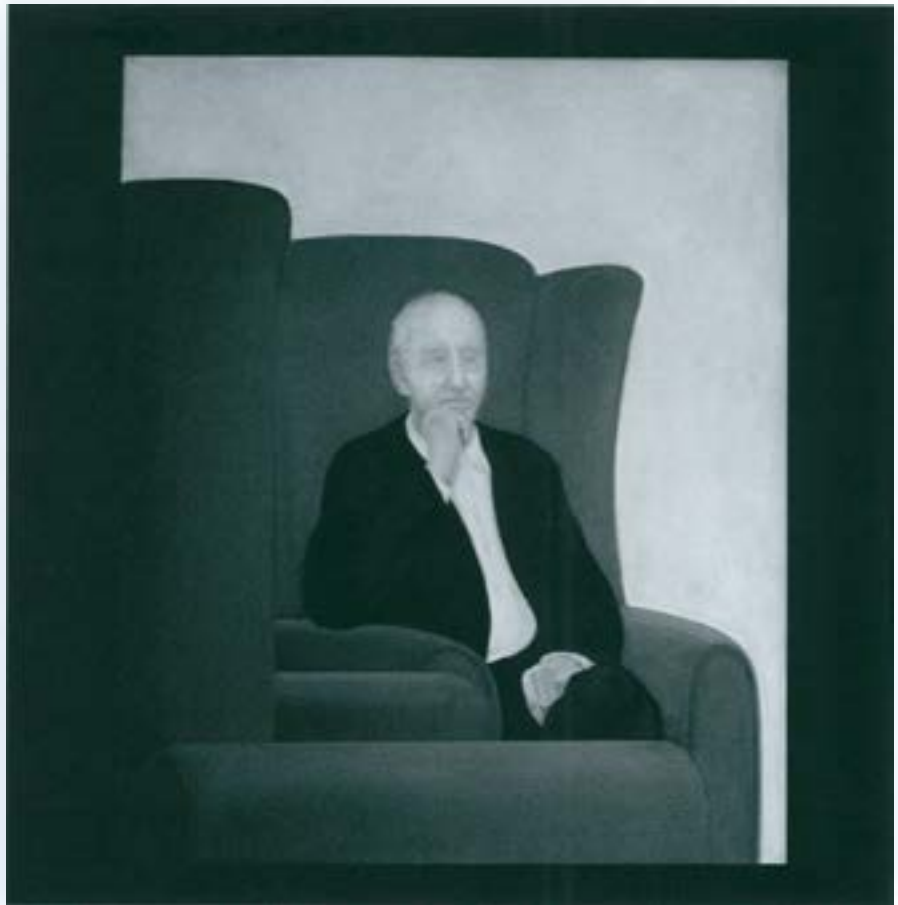
"Absència" (oli sobre tela)