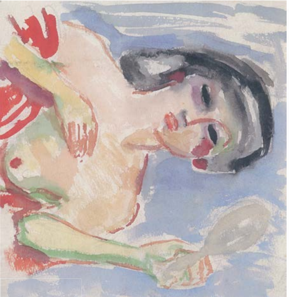
Noia del mirall